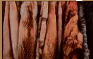
Pelze aller Art

Machen Sie Ihren Pelz und Ihr Gold zu Bargeld!