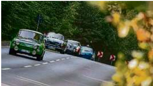
Teilnehmen dürfen Autos bis Baujahr 2004.