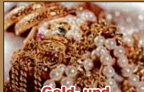
Gold- und Silberschmuck