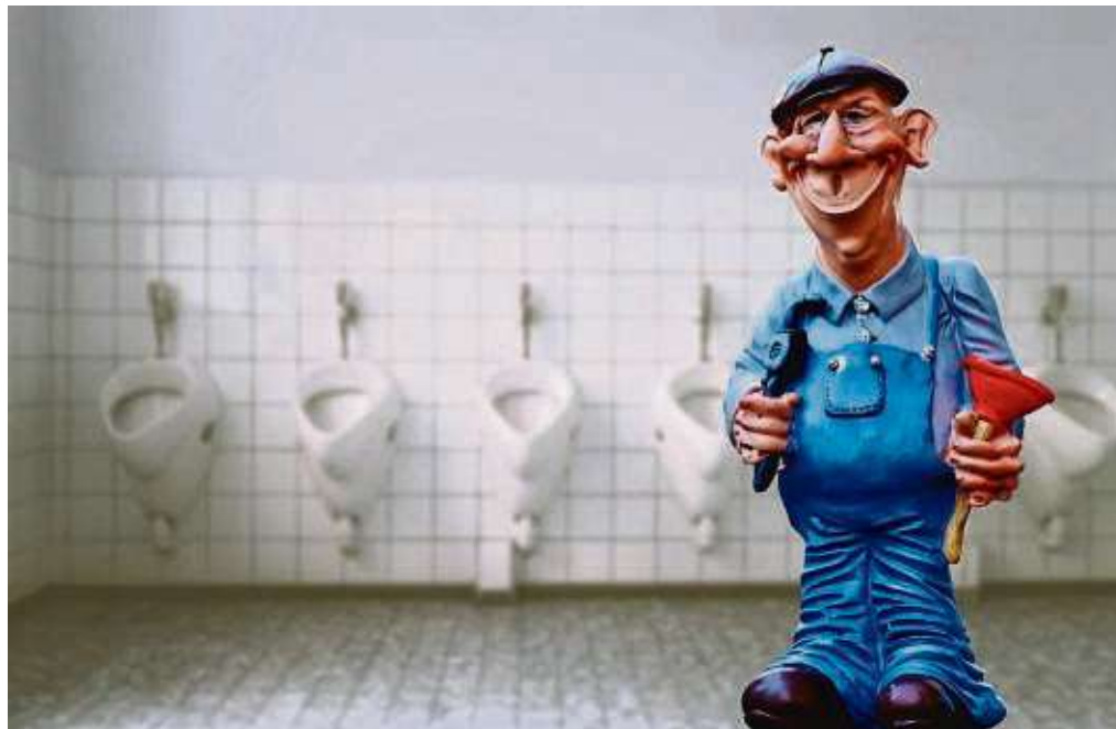
Das Thema Sauberkeit in den Schultoiletten erregt derzeit die Gemüter und wird ganz unterschiedlich vom Kreis und vom Kreisschülerrat bewertet.

Anzeigenpreis nach Preisliste 63 vom 1. 1. 2024 Falls Sie diese Zeitung nicht mehr erhalten möchten, bitten wir Sie, einen Werbeaufkleber mit dem Zusatzhinweis „bitte keine kostenlosen Zeitungen“ an Ihrem Briefkasten anzubringen. Ideal wäre auch ein Hinweis unter Angabe Ihrer Anschrift auf www.frankfurter-wochenblatt.de unter dem Reiter Zustellung, damit wir unsere Träger informieren können.