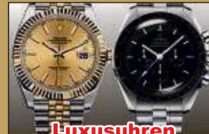
Luxusuhren aller Art