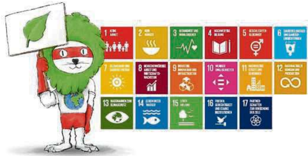
Die 17 Ziele des Hochtaunuskreises

Treffpunkt für die Führung ist der Eingang am oberen Parkplatz des Waldfriedhofes. Die Teilnehmerzahl ist begrenzt. Die Teilnahmegebühr beträgt 4 Euro. Infos und Anmeldung unter ☎ 0179 6700596 oder per E-Mail an historisches-hofheim@email.de . Die Begehung des oberen Teiles des Waldfriedhofes wird zum ersten Mal angeboten.