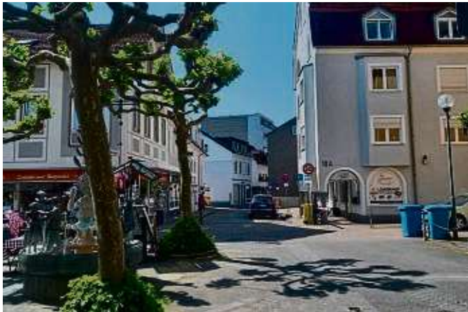
Dieser Bereich wird optisch aufgelockert.

BAD SODEN (red) – Die Aufwertung der Bad Sodener Innenstadt und die Umsetzung des Mobilitätskonzepts schreiten zügig voran. Am Dienstag hat die Sanierung der Straße Zum Quellenpark auf einer Länge von 120 Metern zwischen dem Platz Rueil-Malmaison und der Einmündung Brunnenstraße begonnen. Als Erstes stehen die Erneuerung von Kanal- und Wasserhausanschlüssen an. Wer wissen möchte, wie dieser Bereich nach seiner Fertigstellung gestaltet ist, kann sich die bereits fertigen Straßenabschnitte Zum Quellenpark/Dachbergstraße und Brunnenstraße/Wiesenweg anschauen. Sie sind ebenfalls Bestandteil des mit großer Beteiligung der