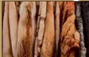
Pelze aller Art