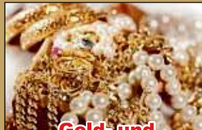
Gold- und Silberschmuck