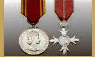
Medaillen / Orden