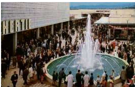
Bei der Eröffnung strömten Tausende zum MTZ.

In den vergangenen 60 Jahren hat das MTZ einen stetigen Wandel erfahren. Die Gebäudearchitektur wurde den wirtschaftlichen und zeitgenössischen Erfordernissen angepasst. Auch Ladengeschäfte ha-