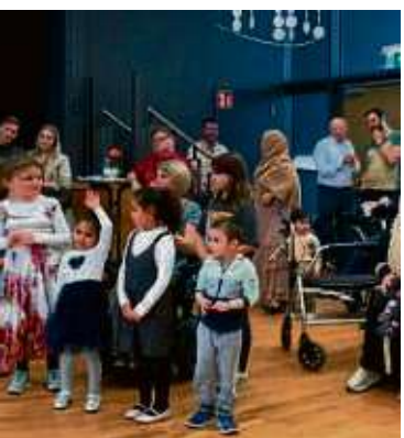
Die Kinder spielen Trommeln, Rasseln und Banjos auf der Bühne.