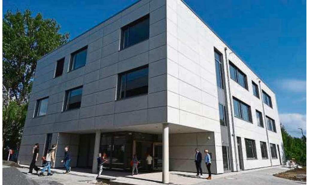
Der Erweiterungsbau der OPS mit Schülern beim Einzug

Die Möbel wurden geliefert und interaktive Tafeln eingebaut. Anschließend sollen im bestehenden Gebäude auf den verschiedenen Etagen neue Räume für die Betreuung geschaffen werden. Außerdem wird der Speisesaal auf mehr