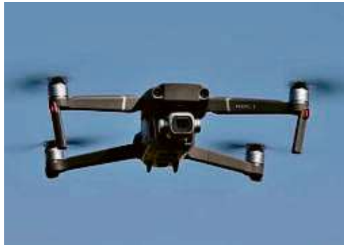
Mit einer Drohne wird die Feuerwehr das Festgebiet am Freitag überfliegen.

Wegen Bauarbeiten wird es erforderlich, die Straße „Talweg“ in Kronberg in Höhe der Hausnummer 24b am Freitag, 31. Mai, im Zeitraum von 9 bis 13 Uhr zu sperren. Anlieger können im genannten Zeitraum