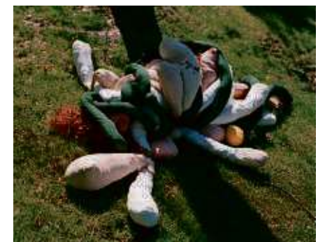
Janaina Tschäpe, „Ovalaria“ SOS-Edition 2011, Auflage: 20+3, nummeriert und signiert, Digitaler c-print, 40,8 x 33 cm

Mit dem Kauf eines limitierten Kunstwerks auf www.sos-edition.de unterstützen Sie Projekte der SOS-Kinderdörfer weltweit.