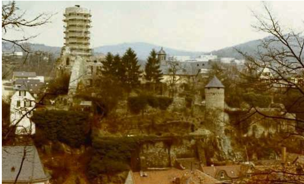
Einrüstung des Bergfrieds 1971

SULZBACH (red) – Der Allgemeine Deutsche Fahrrad-Club Main-Taunus lädt für Sonntag, 26. Mai, zu einer Radtour zur Nickelsmühle Gräfenhausen ein. Die Strecke ist überwiegend flach und führt über rund 70 Kilometer. Eine Einkehr ist geplant. Ganz wichtig: Die Tour fällt bei Regen aus. Abfahrt ist um 10 Uhr am Rathaus Sulzbach, Hauptstraße. Auskunft erteilt Reinhard Niederberger unter ☎ 01512 3982744.