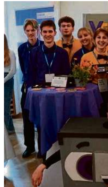
Die Schülerfirma der Eichendorffschule