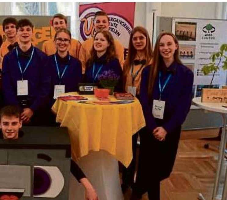
Schülerfirma in Kelkheim-Münster hat beim Landeswettbewerb gesiegt.