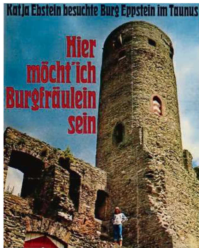
Bei der Erhaltung der alten Mauern der Burg Eppstein möchte Katja mithelfen: Sie gibt dafür ein Konzert Zeitungsartikel von 1972 aus einem Album des Burgvereins: Katja Ebstein gab ein Zusatzkonzert und spendete den Erlös für die Erhaltung der Eppsteiner Burg.

Burgverein fit für die Zukunft machen, um die Stadt weiter bei der Erhaltung der Burg unterstützen zu können.“ Zur Eröffnung am 19. Mai laden Burgverein und Stadt alle Interessierten herzlich um 15 Uhr in das Burgmuseum ein. Die Sonderausstellung „...das verwüstete, verfallene Schloss Eppstein“ ist dort bis 20. Oktober zu sehen und ist auch beim Burgfest und zu Aktionen des Burgvereins zu besichtigen.