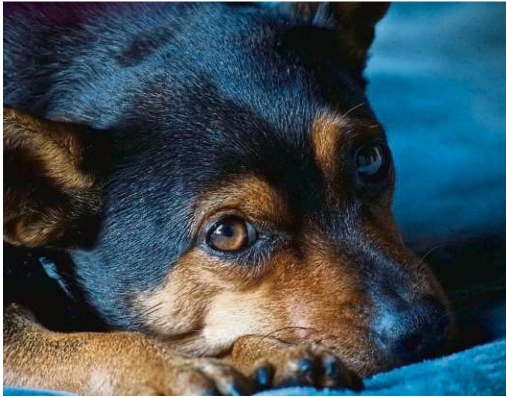
Für den Fall etwa eines Unfalls sollten Frauchen oder Herrchen für ihr Haustier vorgesorgt haben.

Anzeigenpreis nach Preisliste 63 vom 1. 1. 2024 Falls Sie diese Zeitung nicht mehr erhalten möchten, bitten wir Sie einen Werbeaufkleber mit dem Zusatzhinweis „bitte keine kostenlosen Zeitungen“ an Ihrem Briefkasten anzubringen. Ideal wäre auch ein Hinweis unter Angabe Ihrer Anschrift auf www.frankfurter-wochenblatt.de unter dem Reiter Zustellung, damit wir unsere Träger informieren können.