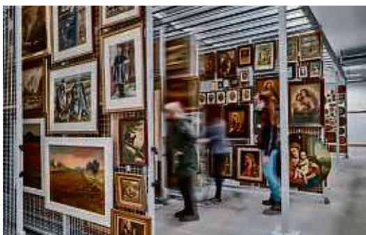
Der Hessenpark bietet Einblicke hinter die Kulissen des Sammlungsgebäudes.

Im Freilichtmuseum Hessenpark gibt es von 9 bis 18 Uhr spannende Einblicke hinter die Kulissen: Mitglieder des Sammlungsteams führen um 11 und 13 Uhr durch das Zentralmagazin und die große Sammlung des Freilichtmuseums. Um 14 Uhr steht die Führung der wissenschaftlichen Volontärin Stephanie Reimann auf dem