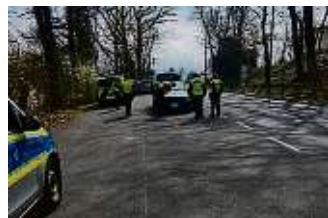
23 Fahrzeuge wurden kontrolliert.

KÖNIGSTEIN (red) – Kein zufriedenstellendes Ergebnis: Bei einer allgemeinen Verkehrskontrolle des städtischen Ordnungsamtes, des Regionalen Verkehrsdienstes Hochtannus und der Stadtpolizei in Mammolshain, Am Mönchswald, wurden nur zwei Mal keine Mängel verzeichnet. Insgesamt wurden 23 Fahrzeuge, darunter 15 Autos, sieben Kleintransporter und ein Roller kontrolliert und folgende Verstöße festgestellt: Zehn Mal war der Sicherheitsgurt nicht angelegt. Das kostet 30 Euro. Bei sieben Verkehrsteilnehmenden fehlte der Verbandskasten oder es war dessen Verfallsdatum abgelaufen. Diese Autofahrer wurden mündlich verwarnt. Für ein fehlendes Warndreieck bei immerhin drei Autos gab es ein Bußgeld von 15 Euro. Fünf Mal fehlte eine ausreichende Ladungssicherheit, zwei Autofahrende hatten ihre Ausweisdokumente vergessen und fünf waren ohne das Original der Zulassungsbescheinigung unterwegs. Bei einem Fahrzeug war der TÜV abgelaufen.