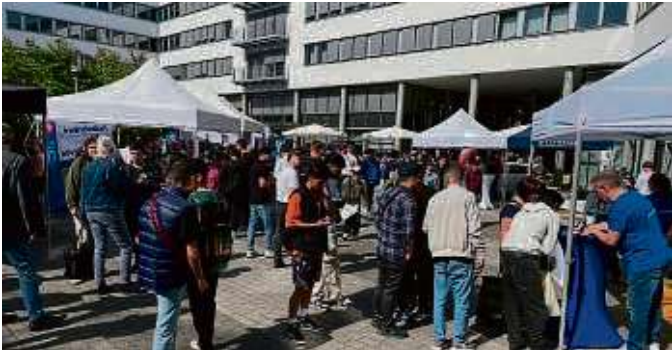
Mehr als 500 Schülerinnen und Schüler informierten sich beim Tag der Ausbildung im Landratsamt.