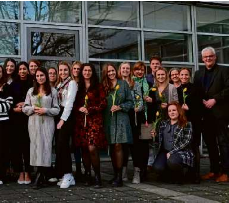
Vorbereitungsdienst. Sie treten den Schuldienst im Hochtannus- und im Wetterstein.