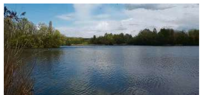
Der etwa zehn Hektar große Weiher liegt inmitten eines Naturschutzgebiets.

Der etwa zehn Hektar große Weiher liegt inmitten des