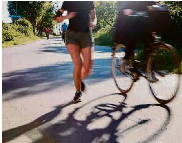
Sport treiben ist gesund: Joggerin und Fahrradfahrer auf dem Main-Radweg.

Alle Bewegungs-Angebote stehen auf der Internetseite www.offenbach.de/of-bewegt -sich. Damit diese Angebote bekannt werden, hat die Stadt Offenbach viele Post-