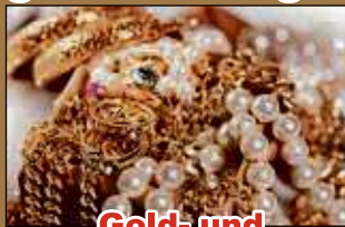
Gold- und Silberschmuck