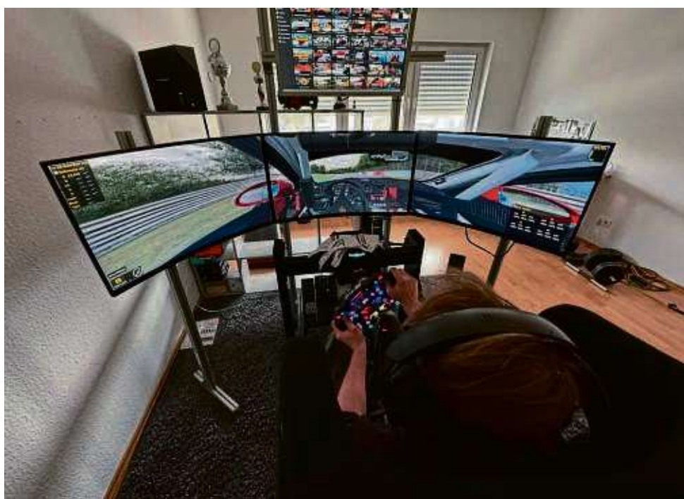
Mit 241 über die Piste: Wie Flugzeugpiloten üben auch Motorsportler in Simulatoren. Ein Rennauto ist dabei genauso schwierig zu steuern wie in der realen Welt.