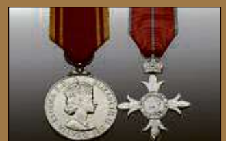
Medaillen / Orden