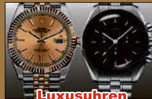
Luxusuhren aller Art