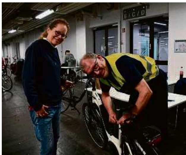
An der Servicestation ist Feintuning angesagt.

Dabei konnte der Basar an frühere Erfolge anknüpfen und 600 Fortbewegungsmittel aus der Welt des Zweirads anbieten. Verkäufer hatten bereits die frühen Morgenstunden genutzt, ihre Räder abzugeben; mancher, weil er zu viele der guten Stücke aufbewahrt, andere, weil sie aus