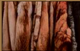
Pelze aller Art

Machen Sie Ihren Pelz und Ihr Gold zu Bargeld!