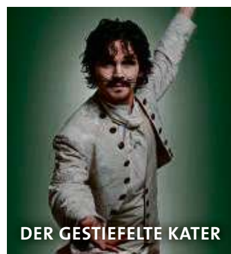
DER GESTIEFELTE KATER