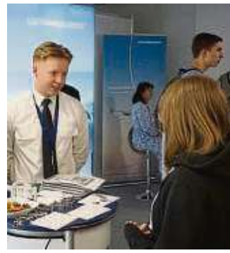
Bei der Vocatium gibt es Infos aus erster Hand.

Hilfreiche Einblicke in die Berufswelt bietet das digitale „vocatium magazin“: Neben Lesestoff zu Bildungsthemen