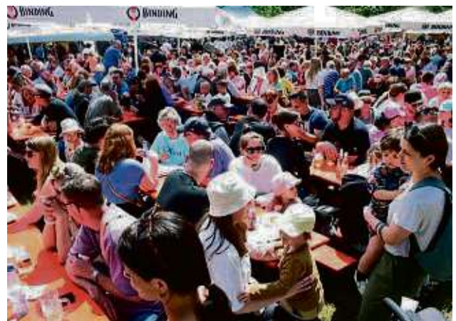
Den größten Ansturm verzeichnete wieder das Vatertagsfest der Mühlheimer Feuerwehr. Seit 50 Jahren feiern die Brandschützer in Höhe des Bieberer Wegs am Waldrand.