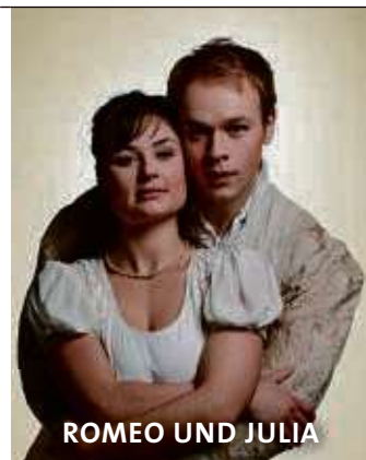
ROMEO UND JULIA