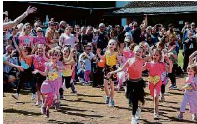
Flashmob hieß eine Attraktion der Tanzgruppen in Lämmerspiel.