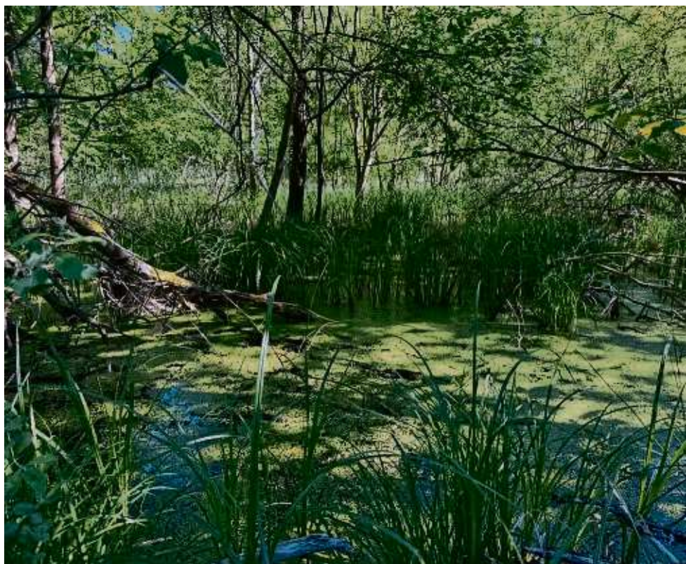
Wald unter Wasser: Links und rechts der verlängerten Tempelhofer Straße sind stattliche Feuchtgebiete entstanden. Das ist gut für die Natur – auch für die Stechmücken, die dort beste Lebensbedingungen vorfinden.