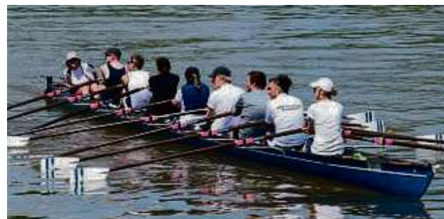
Der Mühlheimer Ruderverein begrüßte rudernde Gäste aus anderen Vereinen.