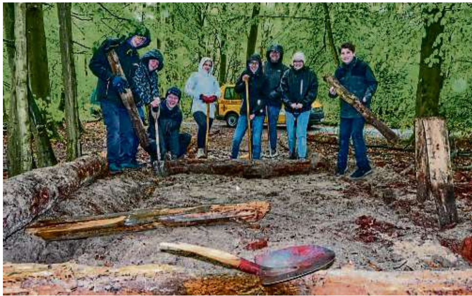
Junge Menschen haben sich auf dem Spielplatz Haulewald mächtig ins Zeug gelegt.

Groß war die Spannung, als in der Kirche St. Konrad in Offenbach die Aufgaben für die acht Teams bekannt gegeben wurden, die sich entlang der „Main-Linie“ an der Aktion beteiligen. Unter ihnen ist die Katholische Jugend aus Neu-Isenburg. „Vor fünf Jahren engagierten wir uns beim Kinder-