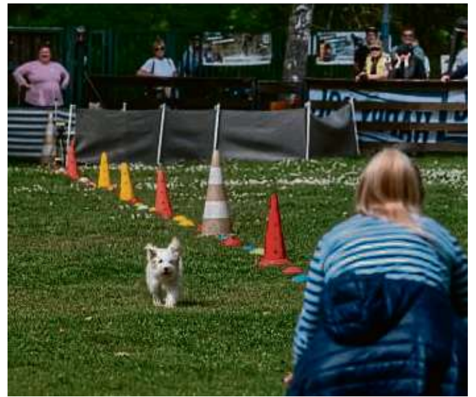
Viel Spaß hatten alle Beteiligten beim Hunderennen in Offenthal.