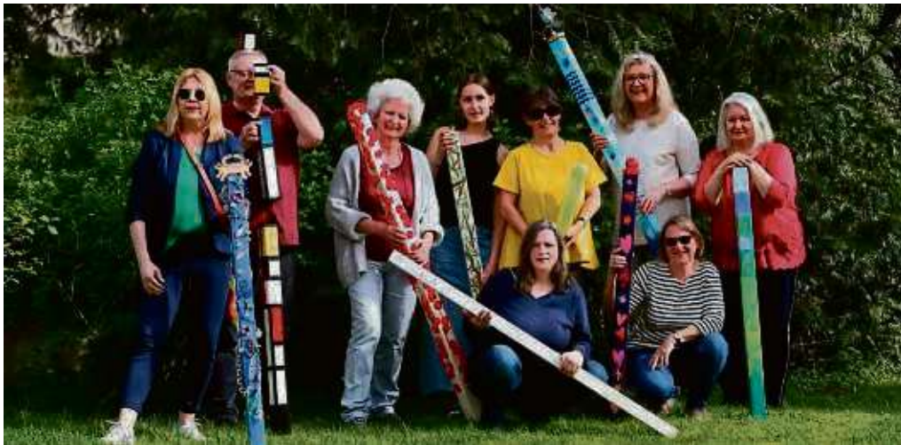
Farbenfrohe Stelen haben die Mitglieder des Langener Künstlerkollektivs Art People gestaltet. Sie sind nun vor der Stadtkirche zu sehen.

Die Wochenzeitung für Egelsbach, Erzhausen, Langen und Mörfelden-Walldorf