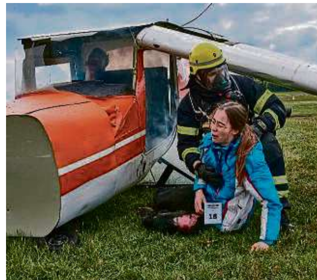
Ein Feuerwehrmann rettete bei der Übung die laut Drehbuch schwer verletzte Pilotin der Unglücksmaschine, im Cockpit sitzt noch der ebenfalls schwer verletzte Flugschüler.

So regelte ein Feuerwehmann die Zufahrt zur Unfallstelle, auf dem Flugplatzgelände dirigierte „Einweiser“ Feuerwehrfahrzeuge und Rettungswagen der Johanniter. Und auch die Polizei war mit einem Großaufgebot vor Ort und musste mit in die Rettungsaktion eingebunden werden. „Wir erwarten Fehler, aber genau das wollen wir alles herausfinden und verbessern“, verweist Christian Klöppel auch auf die vielen Schaulustigen, die sich am Flugplatz eingefunden hatten. Besonders verwies Klöppel auf das realitätsnahe Szenario mit „ziemlich echt wirkenden“ Darstellern als