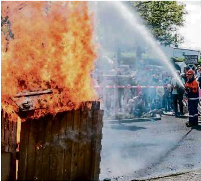
Hier raucht's und brennt's gewaltig: die Jugendfeuerwehr löschte zwei Holzhäuschen.

Der Tag der Feuerwehr, an dem auch das benachbarte DRK beteiligt ist, ist der Höhepunkt im Kalender der Sprendlinger Brandbekämpfer und bestens organisiert. Mit einem umfangreichen Programm wollen die Gastgeber nicht nur ihre Fähigkeiten in der Öffentlichkeit präsentieren, sondern auch Werbung dafür machen, dass sich noch mehr Freiwillige in ihren Reihen engagieren.