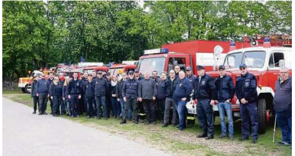
25 alte Feuerwehrautos und ihre Fahrer und Beifahrer: Der Festplatz hinter der Offenthaler Feuerwehr war der Startpunkt für die Ausfahrt der Oldtimer-Parade zum Badensee Hainburg.