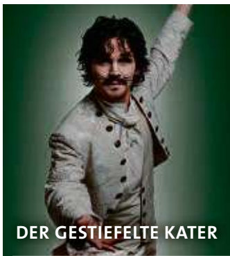
DER GESTIEFELTE KATER