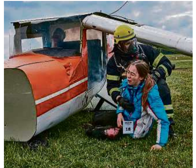
Ein Feuerwehrmann rettete bei der Übung die laut Drehbuch schwer verletzte Pilotin der Unglücksmaschine, im Cockpit sitzt noch der ebenfalls schwer verletzte Flugschüler.