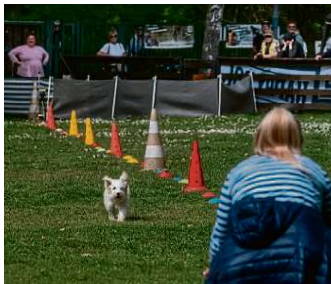
Viel Spaß hatten alle Beteiligten beim Hunderennen in Offenthal.