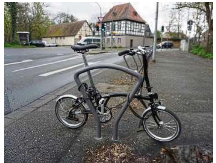
Bislang stehen kaum Fahrräder an den 29 neuen Ständern auf der Isenburger Schneise nahe am Frankfurter Haus.

Gemeinsam mit der Stadtverwaltung hat die Großstadt das kleine Vorhaben geplant. Finanziert haben es die Frankfurter. Der Effekt für die Umweltfreunde aus Neu-Isenburg ist positiv: Aus dem Westend kommend, können Radler den beleuchteten Schleichweg von der Friedensallee zur Isenburger Schneise nehmen und gemütlich den nun freien, von Kunststoff-Bauelementen geschützten Radweg zu den neuen Stellplätzen fahren, um das Radl sicher abzuschließen.