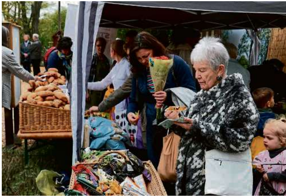
Andrang am Foodsharingstand: Hier konnten sich die Besucher mit geretteten Lebensmitteln versorgen.

Hoch im Kurs steht an diesem Mittag die Pflanzenberatung. Der Kräutergarten hat viele Mitglieder mit grünem Daumen, die Jungpflanzen angezchtet haben, die zum Start der Gartensaison ein heimisches Beet suchen. Da wird intensiv gefachsimpelt, was Tomate, Erdbeere oder Heilkräuter für einen Standort brauchen. Die Gärtnerinnen laufen mit den Gästen durch die Beete und geben Tipps.