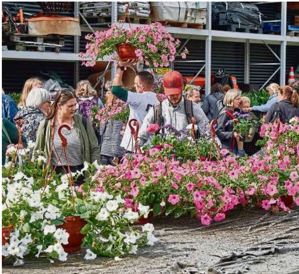
Groß ist immer der Andrang beim Tag der offenen Tür des Dienstleistungsbetriebs. Besonders begehrt ist der Blumenverkauf.

Wer ein neues Fahrrad benötigt, kommt ebenfalls auf seine Kosten: Ab 11.30 Uhr werden Fahrräder und andere Schnäppchen durch das Bürgeramt versteigert. Erstmals dazu gehören auch verloren gegangene Smartphones, die seit mindestens sechs Monaten im Fundbüro lagern. Dank der Firma