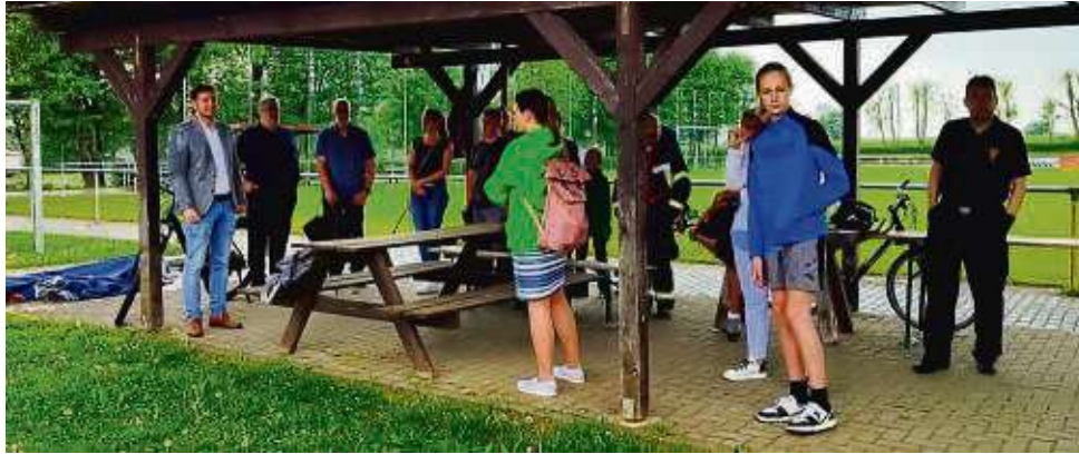
Der Bürgermeister hatte mehr Interesse erwartet: Nur eine Handvoll Jugendliche war gekommen, um seine Ausführungen zu den Plänen am Bolzplatz zu hören.

Der Baukörper, so Alt werde sechs Fahrzeugboxen, ein Lager und eine Waschbox umfassen, dazu sanitäre Einrichtungen, Umkleide- und Schulungsräume. Auch müssen