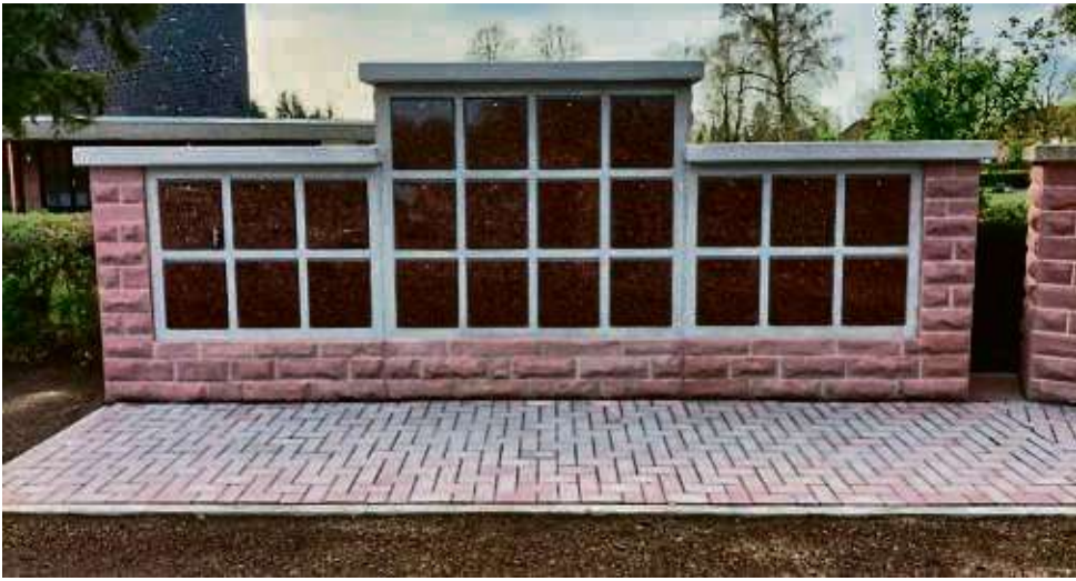
Auf dem Neuen Friedhof Langendiebach wurde die Urnenwand vergrößert.