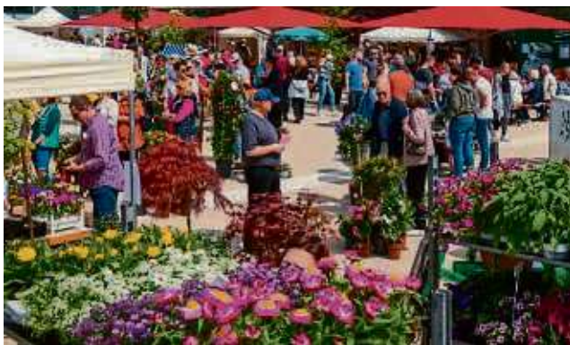
So bunt soll es werden: Der Frühlingsmarkt in Bruchköbel wirft seine Schatten voraus.

Auch die Blühbotschafter vom Projekt Main.Kinzig.Blüht.Netz sind vertreten. Um 12 und um 15 Uhr bieten sie zwei Vorträge zum naturnahen Gärtnern und zum Thema Wildbienen an. Im Stadthaus wird eine Wanderausstellung von Main.Kinzig.Blüht.Netz zu sehen sein. Der Frühlingsmarkt ist auch der Start für einen Sonnenblumenwettbewerb, bei dem die größte Sonnenblume Bruchköbels gesucht wird. Die Gärtnerinnen und Gärtner des Bauhofs verteilen an ihrem Stand Sonnenblumen-