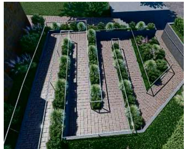
So soll der neue barrierefreie Zugang zur Kirche einmal aussehen. Derzeit liegt der Plan noch in der Schublade.

Auto Center Milinski GmbH Am Germanenring 5 • 63486 Bruchköbel Telefon 0 61 81 / 57 89 00 • info@ac-milinski.de www.milinski.de