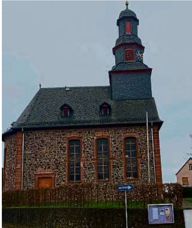
In die Kirche in Ravolzhausen wurde in den vergangenen Jahren viel investiert.

Unter anderem wurden der Innenraum und die Orgel in