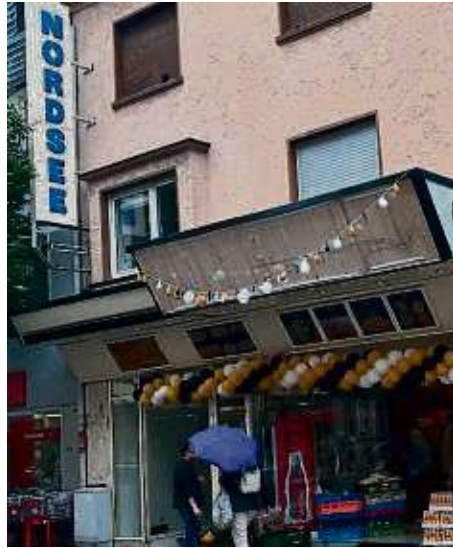
Wo zuletzt in der Nordsee-Filiale Fische verkauft wurden, ist kürzlich ein Lebensmittelgeschäft eingezogen.