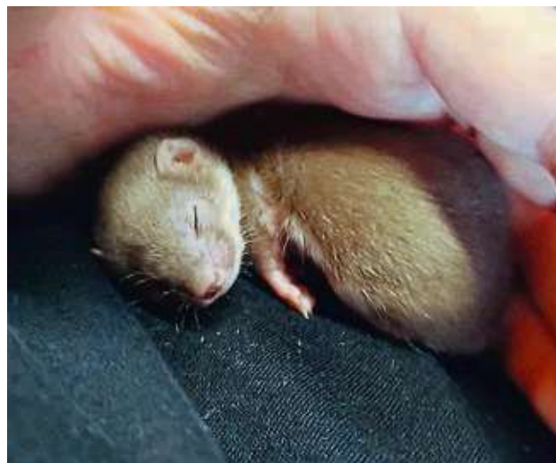
Auch Energiebündel müssen mal schlafen. Mittlerweile hat sich das Fell des Wiesels dunkler gefärbt.