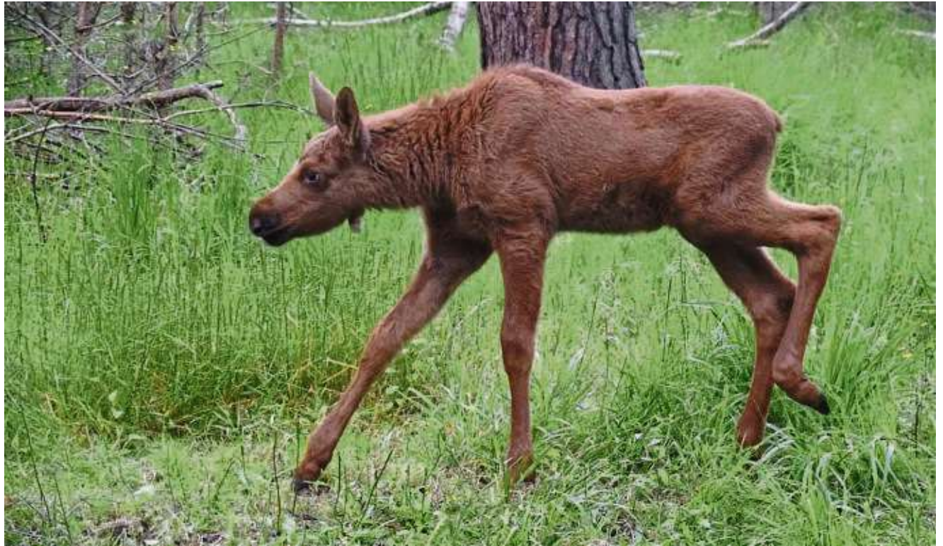
Stakst neugierig durch das Gehege: das Elchkalb, das im Mai zur Welt kam. Mutter Johanna hat stets ein waches Auge auf den Sprössling.

Selten war die Alte Fasanerie so jung wie in diesem Frühjahr.