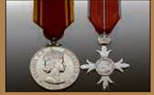
Medaillen / Orden