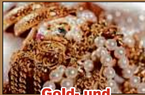
Gold- und Silberschmuck