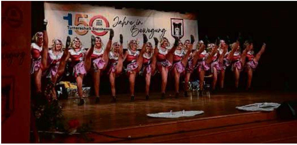
Schautanz gehörte zum Programm bei der Jubiläumsfeier der Turnerschaft Steinheim in der Kulturhalle.