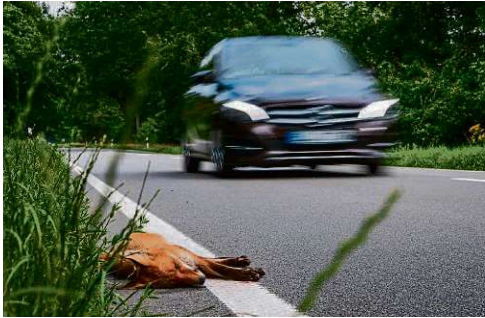
In dem Fall war es schon zu spät: Tempo drosseln, empfiehlt die Polizei vor allem an den Stellen, die mit Wildwechsel-Schildern gekennzeichnet sind.

Die Polizei führt in diesen Bereichen auch immer wieder Verkehrskontrollen sowie Geschwindigkeitsmessungen durch, da sich Fahrzeugführer oftmals nicht an