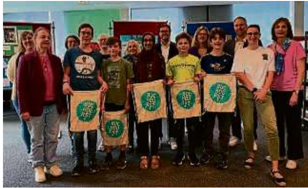
Die Auftaktveranstaltung der Buchdurst-Sommer-Lese-Challenge fand in der Schulbibliothek der Karl-Rehbein-Schule statt. Dabei stellten lesebegeisterte Schüler einige Bücher vor.