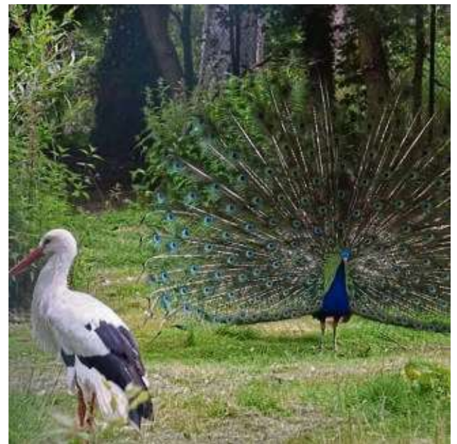
Ein imposantes Bild: der radschlagende Pfau. Daneben einer der Störche, bei denen es Jungtiere gibt.