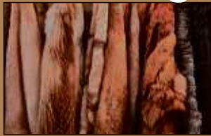
Pelze aller Art

Machen Sie Ihren Pelz und Ihr Gold zu Bargeld!