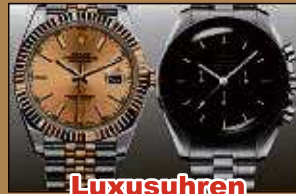
Luxusuhren aller Art