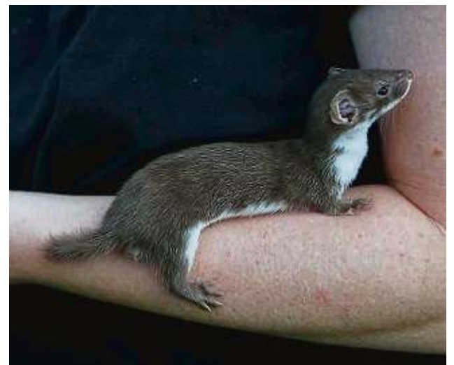
Nur halb so groß wie ein Hermelin wird ein ausgewachsenes Mauswiesel.

ebenfalls mit der Hand aufgezogen hat. Sieben waren es ursprünglich, nach der erfolgreichen Auswilderung haben nur noch zwei das Wohnzimmer beschlagahmt. Zweimal am Tag dürfen sie hier ihrem Bewegungsdrang freien Lauf lassen. Dem Mauswiesel, das eher bei Tag aktiv ist, wurde das Schlafzimmer überlassen. „Sobald auf der Station eine große Voliere frei wird, wird er dort blei-