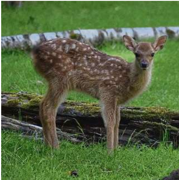
Auch beim Sikawild hat sich Nachwuchs eingestellt, darunter sind auch Zwillinge.