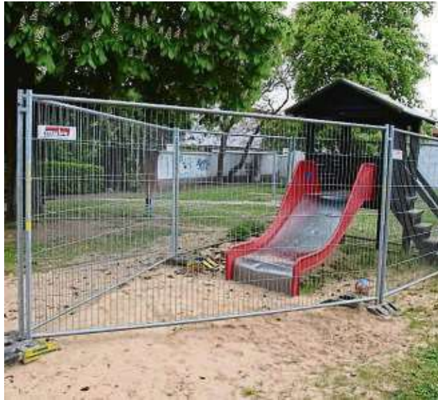
Die Rutsche des Abenteuerspielplatzes kann derzeit nicht benutzt werden.

Mehrere Ausschussmitglieder wiesen jedoch auf Punkte der Mängelliste hin, deren Abarbeitung noch ausstehe. So seien Teile des Spielplatzes „Rotes Erdgewann“ nach wie vor gesperrt. Am Seilgarten des Spielplatzes ist „ein Pfosten von außen gefault“, heißt es im Prüfbericht. „Da dieser Pfosten sehr hoch ist, ist die Gefahr beim Umsturz eines Pfostens sehr groß.“ Neumann kündigte an, dass ein Ortstermin auf dem Spiel-