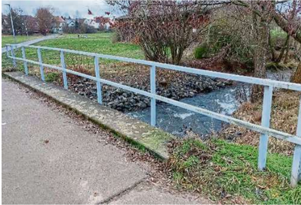
Das bestehende Geländer auf der Brücke am Obermühlenweg weist Mängel auf, die auch die Verkehrssicherheit – wenn auch geringfügig – beeinträchtigen. Deshalb soll im Laufe des Jahres ein neues Geländer errichtet werden.

Die angenommene Beschlussvorlage sah nun die Prüfung einer möglichen Gefahrenlage vor und falls diese durch das Fachamt festgestellt würde, sollte der Magistrat die notwendigen Maßnahmen veranlassen, um diese zu beseitigen. Dafür sollten die erforderlichen finanziellen Mittel im Haushalt für