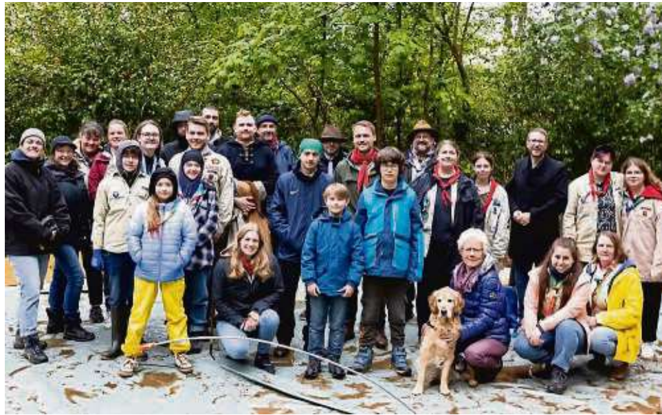
Kräfte gebündelt: Die Rodenbacher Pfadfinder Stamm Barbarossa arbeiteten zusammen 350 Stunden.