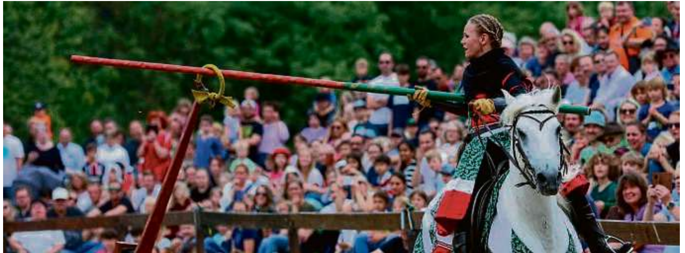
Bei dem Pfingstturnier treten Ritter zu Pferd und Fuß gegeneinander an.

In den klassischen Disziplinen wie zum Beispiel dem „Ringe stechen“, dem Bogenschießen vom Pferde aus bis hin zum klassischen „Lanzenstechen“ in voller Rüstung auf dem Rücken ihrer treuen Rösser versuchen die edlen Kämpfer, ihre Gegner zu Fall zu bringen. „Bei rasantem Ritt über den Turnierplatz der Ronneburg werden Helden geboren und das Böse bezwungen“, heißt es in der Ankündigung. Ein buntes Fahnenmeer mit allerlei Rittern, Adligen, Kreuzfahrern und sonstigen Abenteurern begleitet das Markttreiben in allen Winkeln der Burg. Gaukler und Musikanten sorgen für allerlei Kurzweil und verzaubern