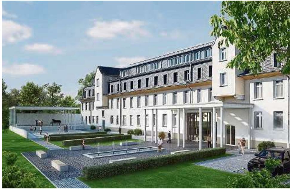
Der geplante Bildungscampus im „Bruder 3“ im Pioneer Park soll unter anderem die Brüder-Grimm-Berufsakademie (BGBA) beherbergen.

Nach der Vorstellung der Pläne sowie dem Kauf der Immobilie durch die Stadt im Juli 2022 wurde es in der Folgezeit zumindest in der Öffentlichkeit ruhig um das Projekt. Im Hintergrund jedoch liefen die bürokratischen und zeitintensiven Prozesse, die für solch ein Vorhaben notwendig sind: Grundlagenermittlung, Vorplanung, Entwurfsplanung, EU-weites Vergabeverfahren zur Ausschreibung der Objektplanung und der Planung der technischen Gewerke. Die Planer und das Projektteam haben, wie die