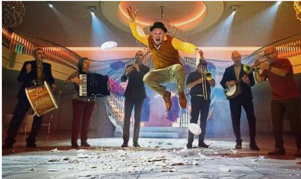
Die Amsterdam Klezmer Band ist zum ersten Mal beim Kultoursommer zu Gast. Zur Besetzung gehören Blechbläser, Kontrabass, Akkordeon und Schlagzeug.

Zum ersten Mal beim Kultoursommer zu Gast ist die Amsterdam Klezmer Band (16. Juli). Eine Gruppe, die schon lange auf Schoberts Wunschliste stand und mit der er der Reihe einen persönlichen Stempel aufdrück-