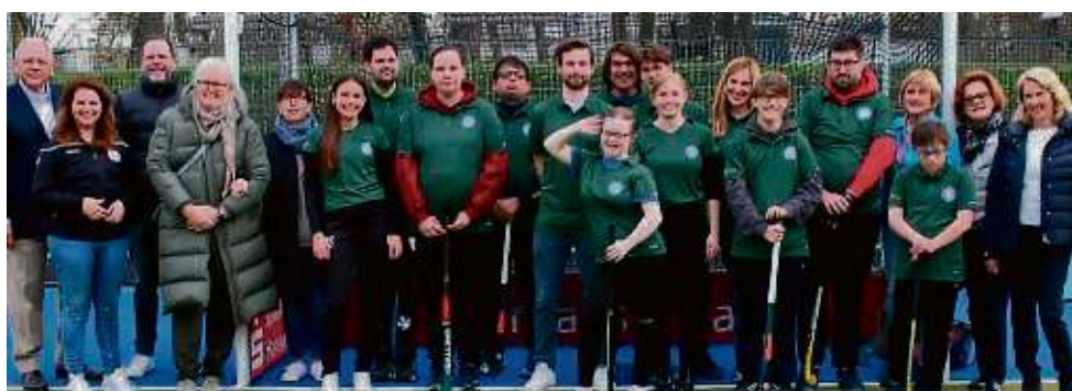
Die Spielerinnen und Spieler der Specialhockeymannschaft werden nun ihre offiziellen THC-Trikots auf dem Platz tragen können.