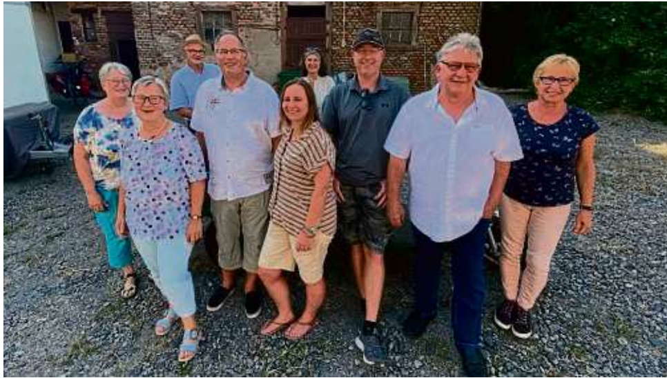
Haben ihre Planung für dieses Jahr abgeschlossen: die Mitglieder des Kulturvereins Wundertüte.