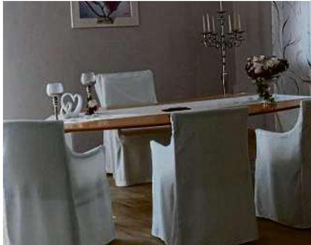
Das neue Trauzimmer wurde im Obergeschoss der Erlenhalle eingerichtet, ist allerdings nicht barrierefrei.

Im Obergeschoss der ans stillgelegte Hallenbad angeschlossenen Erlenhalle wurde nun ein neues Trauzimmer liebevoll dekoriert und eingerichtet. Hier werden En-