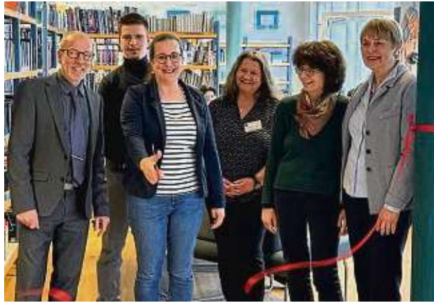
Grund zur Freude: Mit dem Durchtrennen des roten Bandes wurde die neu gestaltete Präsenzbibliothek des Albert-Einstein-Gymnasiums feierlich eröffnet.

Mit der Präsenzbibliothek hält das Albert-Einstein-Gymnasium ein ergänzendes und zeitgemäßes Angebot zum eigenverantwortlichen Lernen