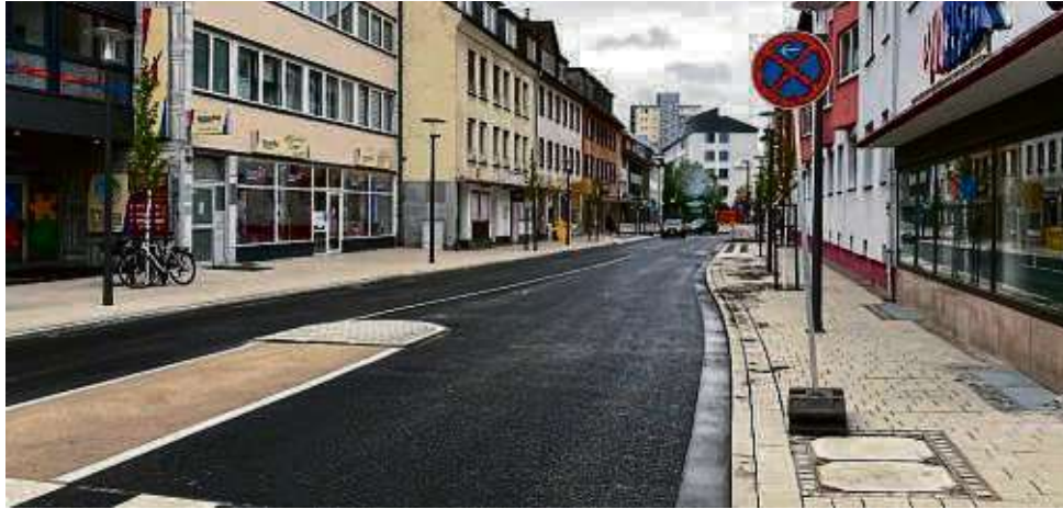
Nach etlichen Verzögerungen sind mittlerweile weite Teile der Römerstraße umgestaltet. Nun beginnt der letzte Bauabschnitt.