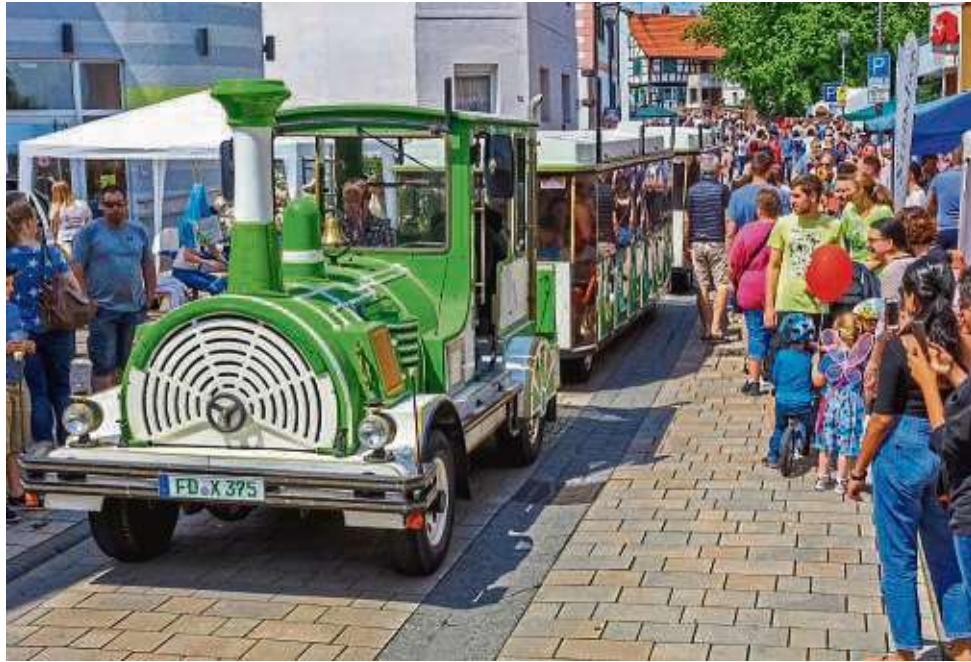
Ein Erdbeersonntag ohne die Bimmelbahn ist einfach nicht denkbar. Auch am 9. Juni wird sie wieder durch die Innenstadt fahren. Unser Bild stammt von der letzten Ausgabe der Selbolder Großveranstaltung im Jahr 2022.

Zum Feiern lädt der HGV aber schon vorher ein, denn auch diesmal wird es das Weindorf auf dem Marktplatz geben. „Das startet am Freitag, 7. Juni, um 17 Uhr. Ich werde es zusammen mit