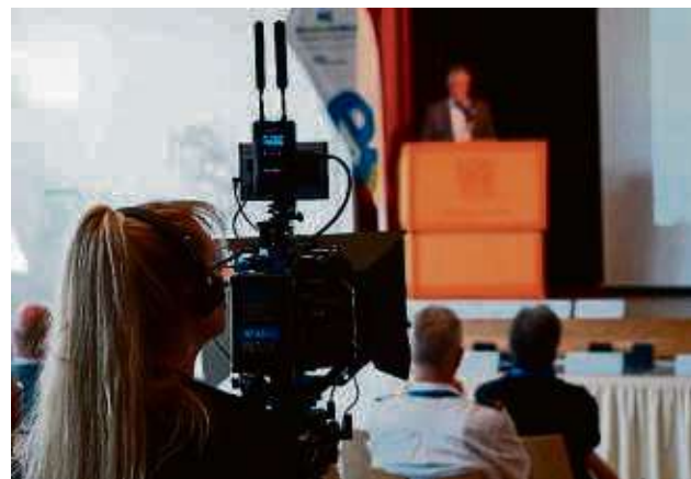
Um Digitalisierung, Verkehr und den Wandel des Wirtschaftsraums im Kreis geht es beim Forum 2030.

Main-Kinzig-Kreis – Beim Forum 2030 treffen Wirtschaft, Wissenschaft und Entscheidungsträger aus Politik und Behörden aufeinander, um gemeinsam über Lösungen für die Zukunft zu sprechen. Bisher lautete der Konferenztitel Emokon, denn der Kongress hat zu Beginn im Jahr 2021 ausschließlich das Thema E-Mobilität behandelt. Die Bandbreite an Vorträgen und Diskussionen im Spessart Forum in Bad Soden-Salmünster hatte sich aber schon in den vergangenen Jahren vergrößert.