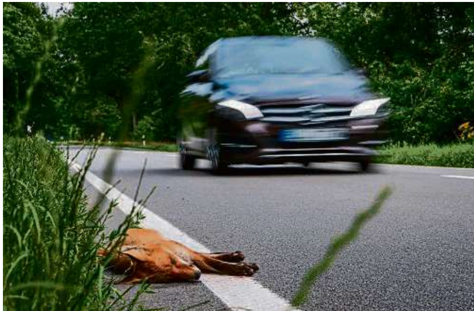
In dem Fall war es schon zu spät: Tempo drosseln, empfiehlt die Polizei vor allem an den Stellen, die mit Wildwechsel-Schildern gekennzeichnet sind.

Main-Kinzig-Kreis – Drei Wildunfälle haben Beamte der Polizeistation in Bad Orb jetzt auf den Straßen ihres Zuständigkeitsgebiets innerhalb von nur kurzer Zeit aufgenommen. In allen drei Fällen blieben die Fahrzeuginsassen unverletzt; die angefahrenen Tiere verendeten allesamt. Die Polizei rät aus diesem Grund zur erhöhten Vorsicht. Die drei genannten Unfälle sind Grund genug für die Polizei, einige Tipps zu geben, wie man sich in Sachen Wildwechsel richtig verhalten kann. Bekannte Streckenabschnitte, an denen häufig Wildwechsel stattfindet, sind laut Pressemitteilung der Behörden in der Regel mit Geschwindigkeitsbegrenzungen oder mit dem Verkehrszeichen „Wildwechsel“ ausgeschildert.