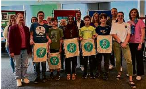
Die Auftaktveranstaltung der Buchdurst-Sommer-Lese-Challenge fand in der Schulbibliothek der Karl-Rehbein-Schule statt. Dabei stellten lesebegeisterte Schüler einige Bücher vor.