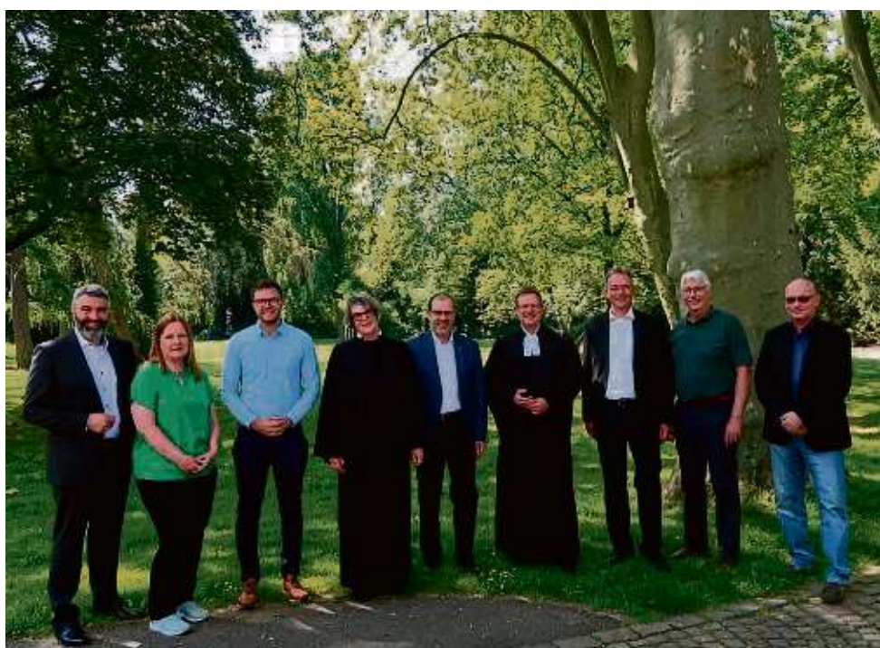
Zahlreiche Gäste kamen beim impulsreichen Gottesdienst der Martin Luther Stiftung im Rahmen des Internationalen Tags der Pflege zu Wort.