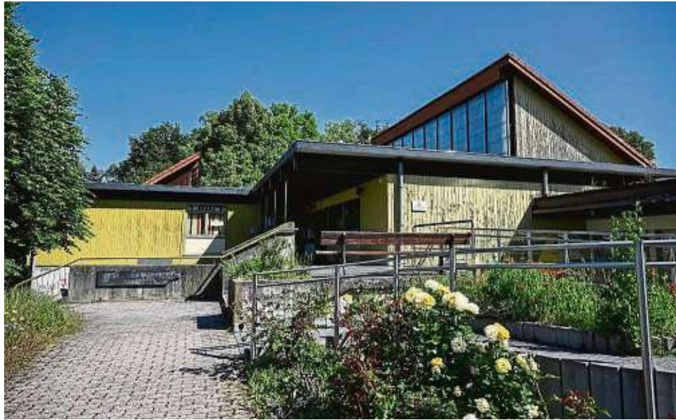
Wieder alles offen: Der Kirchenvorstand nimmt die für Ende des Jahres beschlossene Schließung des evangelischen Gemeindehauses in Hochstadt zurück – und schafft Zeit, ein „tragfähiges Konzept“ zu erarbeiten.

Diese Entscheidung sei am 27. Mai gefallen, nachdem sich der Kirchenvorstand Mitte Mai noch einmal mit den Vereinen, Mitgliedern der Bürgerstiftung und engagierten Gemeindemitgliedern