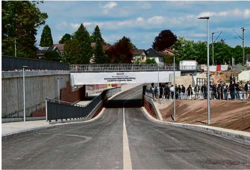
Im Mai 2023 ist die neue Straßenunterführung an der Frankfurter Landstraße eröffnet worden. Sie ist das bislang sichtbarste Zeichen der zukünftigen S-Bahn.

Dabei handele es sich allerdings nicht um ein Projekt im direkten Zusammenhang mit der Nordmainischen S-Bahn, sondern um eine vorgezogene Bestandserneuerung, so eine Bahnsprecherin. Vorabmaßnahmen für das S-Bahn-Projekt wie Rodungen, das Verlegen von Leitungen sowie Kampfmittelsondierungen werden dem-