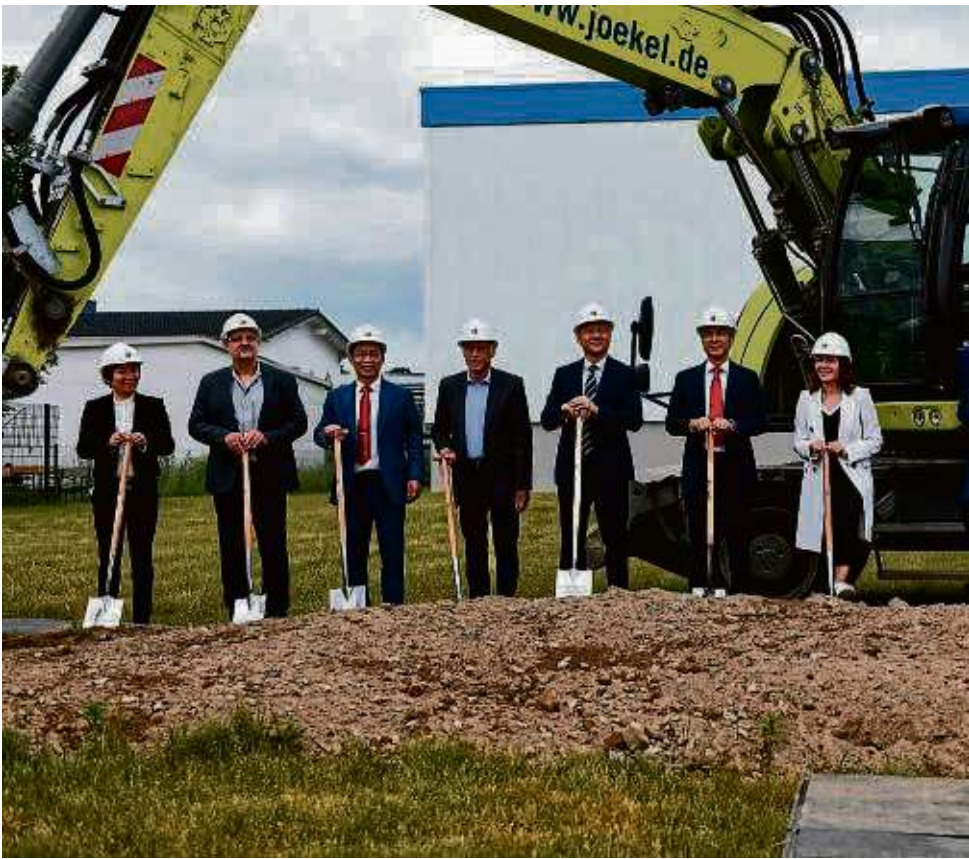
Gemeinsam gaben Vertreter von Hongfa mit den Gästen aus der Politik den symbolischen Startschuss für den Bau der neuen Produktionshalle in Dörnigheim.