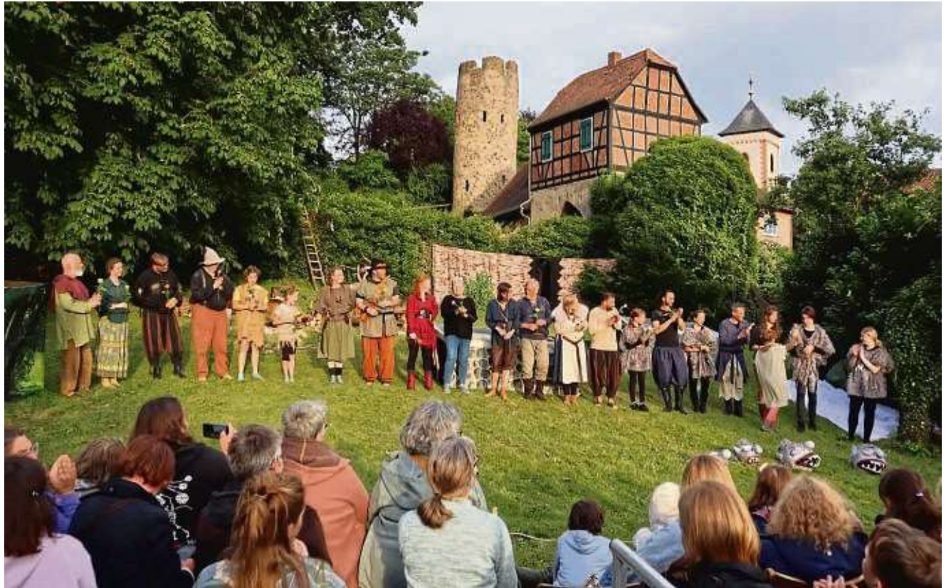
Eine prächtige und natürliche Kulisse bietet der Pfarrgarten in Mittelbuchen, der bei der Premiere ausverkauft war.

Ronja, die Tochter von Räuberhauptmann Mattis und Lovis, ist ein lebhaftes und neugieriges Kind. Je älter sie wird, umso mutiger wird sie. Gleich zu Beginn macht sie deutlich, dass sie kein „Räuberhauptmann“ werden will, wie es seit Generationen Tradition ist in ihrer Familie. Immer häufiger streift Ronja alleine durch den Mattiswald. „Darf ich jetzt raus in den Wald?“, fragt sie nach einem langen und langweiligen Winter in der Burg. Im Wald trifft sie zufällig auf Birk Borkason, der mit seiner Räuberbande in der „Borkafeste“ lebt. Die beiden Kinder freunden sich an, bestehen gemeinsam Abenteuer, sie ret-