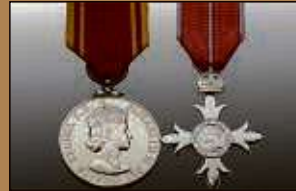
Medaillen / Orden