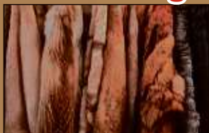
Pelze aller Art

Machen Sie Ihren Pelz und Ihr Gold zu Bargeld!