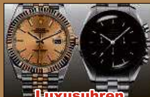
Luxusuhren aller Art