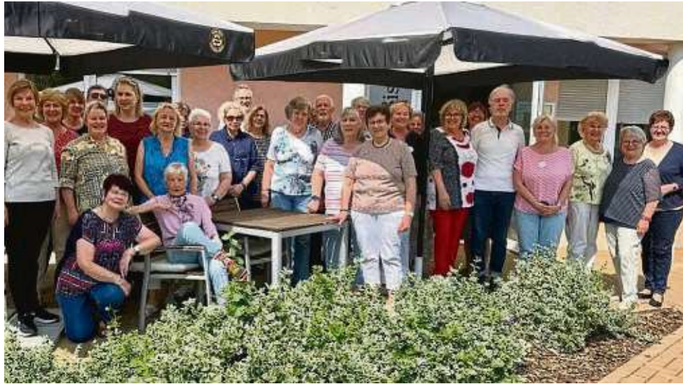
Halten den DRK-Kleiderladen in Büdesheim am Laufen: die Ehrenamtlichen.