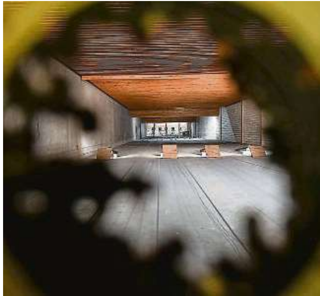
Im November 2023 hat der Kreis die Schießanlage in der Maintal-Halle geschlossen. Die Schützenvereine sind auf der Suche nach Trainingsorten und Geld zur Finanzierung der notwendigen Sanierung.