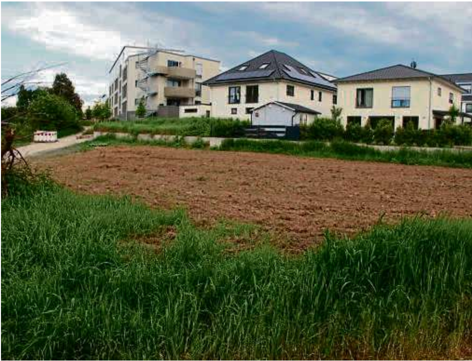
Das umgepflügte Dreiecksgrundstück soll auf Antrag der Grünen Niederdorfelden nun zu einer Blühwiese mit Obstbäumen und Sträuchern werden.