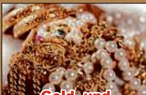
Gold- und Silberschmuck