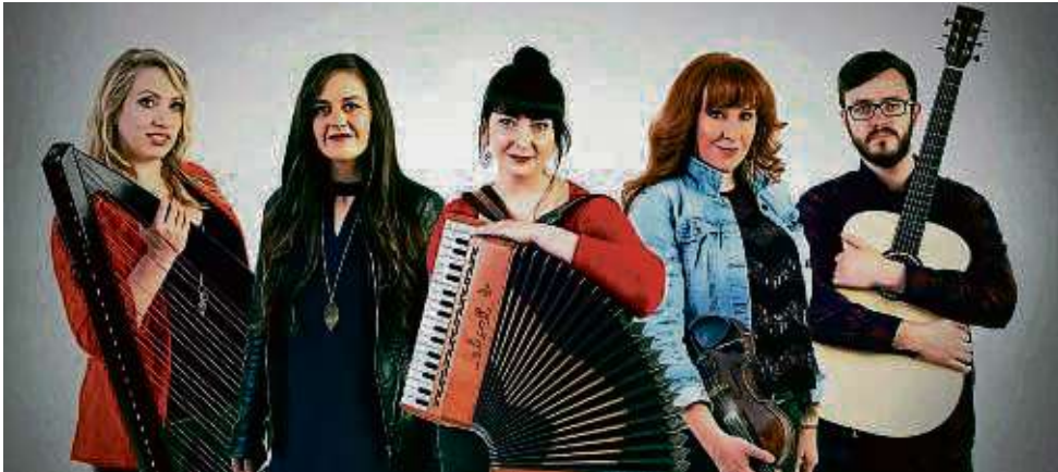
Vier Ladys und ein Hahn im Korb verweben traditionelle keltische Musik mit Elementen der Weltmusik.