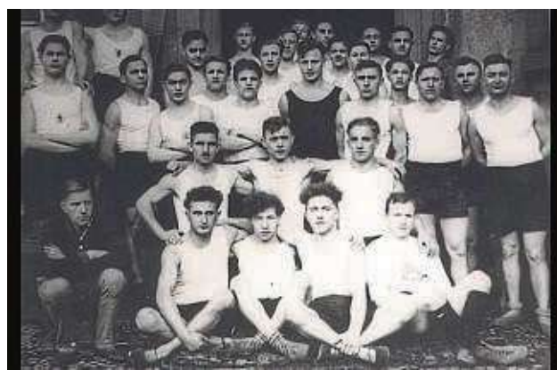
Ausschließlich Männer posierten 1929, fünf Jahre nach Gründung der Freien Turner, für ein Gruppenbild.