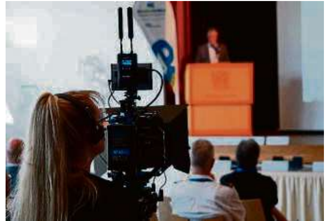
Um Digitalisierung, Verkehr und den Wandel des Wirtschaftsraums im Kreis geht es beim Forum 2030.

Main-Kinzig-Kreis – Beim Forum 2030 treffen Wirtschaft, Wissenschaft und Entscheidungsträger aus Politik und Behörden aufeinander, um gemeinsam über Lösungen für die Zukunft zu sprechen. Bisher lautete der Konferenztitel Emokon, denn der Kongress hat zu Beginn im Jahr 2021 ausschließlich das Thema E-Mobilität behandelt. Die Bandbreite an Vorträgen und Diskussionen im Spessart Forum in Bad Soden-Salmünster hatte sich aber schon in den vergangenen Jahren vergrößert.