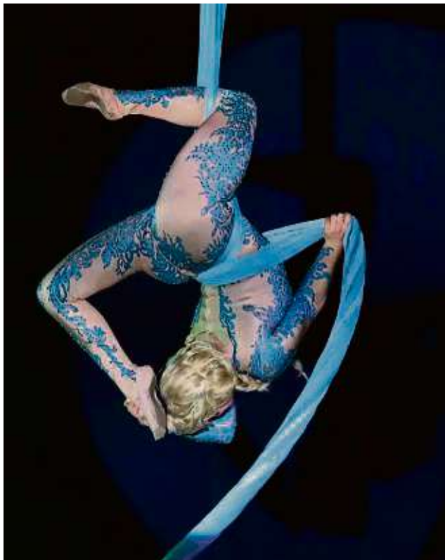
Spektakel für Klein und Groß im Zeltpalast des Circus Baruk auf dem Festplatz in Maintal-Bischofsheim.