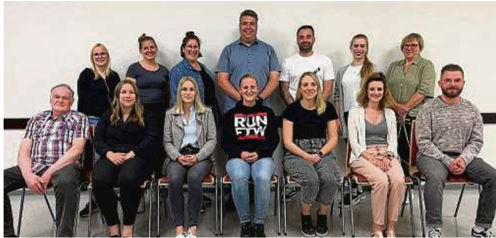
Überwiegend Frauen in führenden Rollen: der aktuelle Vorstand der Freien Turnerschaft Wachenbuchen.

Von Anfang an gab es Raumprobleme: Zunächst war die ehemalige Synagoge Trainingsort. 1953 wurde ein Turnerhäuschen auf dem