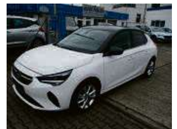
Opel Corsa 1,2i Bj. 21, 19.000 KM, viele Extras, 14.650 €. Autohaus Müller, Industriestr. 7, 63150 Heusenstamm, ☎ 06104-8024444