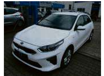
Kia Ceed 1,4i Viele Extras, Mod. 2022, 39.000 KM, 16950 €. Autohaus Müller, Industriestr. 7, 63150 Heusenstamm, ☎ 06104-8024444