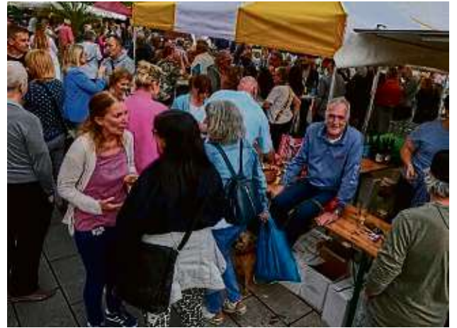
Das Wetter spielte besser mit als vorhergesagt, sodass zahlreiche Kunden und Besucher den Weg zum Platz an der Wallonischen Kirche fanden.

Brötchen sei der Umsatz zufriedenstellend gewesen, sagt die Frau aus Wetterfeld in der Vogelsbergregion. Die Fleischspeise zwischen zwei Brötchenhälften waren eben die passende Ergänzung etwa zum „Domherr“ im Glas.