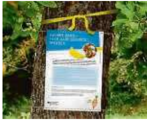
Infoblatt zur Aktion „Gelbes Band“.

den beiden aktiven Erlenseer Obst- und Gartenbauvereinen geerntet und beschnitten. Aber im Rahmen des Projekts „Essbare Stadt“, das auf lange Dauer angelegt ist, zählen jeder weitere Baum und Strauch, die von den Bürgerinnen und Bürgern genutzt werden können.