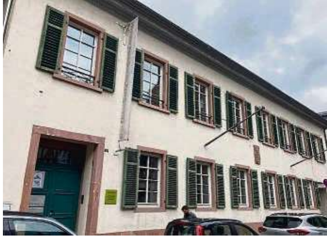
Das Kronberger Haus in Höchst.

Weiter sind mit allen, die gerne an der inhaltlichen und organisatorischen Vertiefung des Projekts mitdiskutieren wollen, gemeinsame Workshops geplant. Gestreut wird der Fragebogen über verschiedene Verteiler, etwa den des Vereinsrings oder den des Stadtteilarbeitskreises. Eines der großen Potenziale des Stadtteils Höchst ist seine reichhaltige Landschaft an engagierten Vereinen, Initiativen und Einrichtungen. Allerdings fehlt es vor Ort an Räumen, die diese für ihre Arbeit nutzen können. Schon lange wird daher die Idee eines zentralen Ortes, an dem ehrenamtliche und gemeinnützige Aktivitäten in Höchst gebündelt werden können, diskutiert. Ein solches Zentrum wurde auch im Handlungskonzept für das Förderprogramm „Innenstadt Höchst“ als Projektidee aufgeführt. Das vom Stadtplanungsamt koordinierte Förderpro-