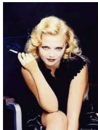
Annett Louisan kommt wieder in die Alte Oper.

sich an 2004: Die größten Hits kamen von Yvonne Catterfeld, den Black Eyed Peas und Usher, im Radio lief Indie-Rock, „R&B“ oder Deutschrock, die erfolgreichsten Mainstream-Alben kamen von Robbie Williams, Anastacia und Norah Jones. Annett Louisan ist da mit „Bohème“ einfach so rein gekracht. Mit spielerischer Leichtigkeit brachte sie Chanson, Jazz, Pop zusammen, schien nirgendwo so richtig hineinzupassen – und wurde doch überall gehört. Weiter geht's! Tickets zu ab 76,90 Euro gibt's online auf eventim.de und an den Vorverkaufskassen.