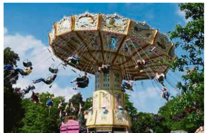
Der Wäldchestag lockt als traditionelles Volksfest zu Pfingsten viele Frankfurter in den Stadtwald ans Oberforsthaus.