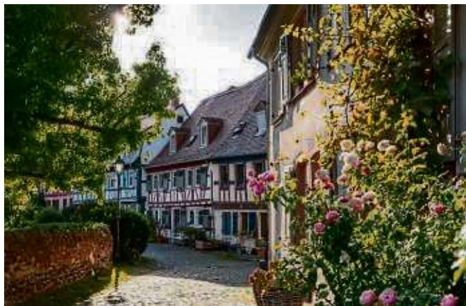
Höchst mit Schloss und Altstadt.

Höchst (red) – Der 26. Mai steht ganz im Zeichen des Fachwerks. Deutschlandweit werden besondere Events, Workshops und Führungen rund um das Fachwerk organisiert, die die Besucher für diese einzigartige Bauweise und ihr besonderes kulturelles Erbe sensibilisieren.