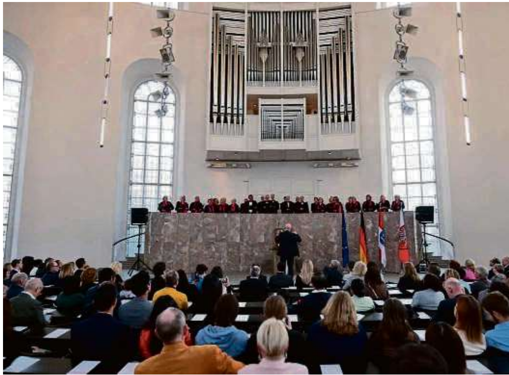
Zum musikalischen Ausklang der Einbürgerungsfeier wurde die Frankfurter Hymne von Adolf Stoltze gesungen.

Altstadt (red) – 2564 Menschen sind 2023 in Frankfurt eingebürgert worden. Um diesen Schritt gebührend zu zelebrieren, hatte die Stadt sie am Freitag, 26. April, zur Einbürgerungsfeier geladen. Oberbürgermeister Mike Josef empfing die Gäste in der Paulskirche. In Frankfurt haben sich im vergangenen Jahr Menschen mit insgesamt 110 verschiedenen Herkunftsstaatsangehörigkeiten dazu entschieden, fortan die deutsche Staatsbürgerschaft zu tragen. „Es ist ein schöner Moment und viel mehr als ein formaler Akt, neuen Staatsbürgerinnen und Staatsbürgern die deutsche Staatsbürgerschaft zu verleihen. Sie alle haben sich bewusst für Deutschland und auch für unser Frankfurt als lebenswerte Stadt entschieden. Ich lade alle dazu ein, dass sie ihre neuen Rechte und Pflichten aktiv nutzen und damit das gesellschaftliche Leben in unserer Stadt bereichern. Dazu gibt es viele Gelegenheiten und Möglichkeiten“, betonte Oberbürgermeister Mike Josef in seiner Rede. Unter den 110 Herkunftsstaatsangehörigkeiten war Syrien mit 198 Personen am stärksten vertreten, gefolgt von der Türkei mit 170, Marokko mit 166 und dem Iran mit 134 neuen Staatsbürgern. Sie alle seien in Frankfurt willkommen, sagte Josef: „In unserer Stadt leben mehr als 750.000 Menschen aus 179 Nationen. Für eine so internationale und weltoffene Stadt wie Frankfurt am Main stellt die Vielfalt kulturellen Lebens eine echte und