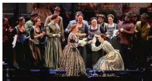
„Elisabeth – Das Musical“ ist bald in neuer Form in der Mainmetropole zu Gast.

Innenstadt (red) – Die Erfolgsgeschichte des Musicals „Elisabeth“ von Michael Kunze und Sylvester Levay geht weiter: In der gefeierten Schönbrunn-Version erstmals auf Gastspielserie läuft es vom 18. Dezember bis 5. Januar 2025 in der Alten Oper Frankfurt. Das Musical hat sich seit seiner Uraufführung 1992 in Wien zum beliebtesten und weltweit erfolgreichsten deutschsprachigen Musical entwickelt: Die dramatische und berührende Geschichte über Leben, Wirken und Leiden der österreichischen Kaiserin sorgte bislang bei mehr als zwölf Millionen Zuschauern in 14 Ländern für Jubel