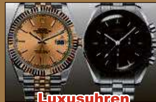
Luxusuhren aller Art