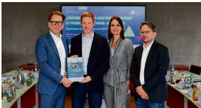
Bei der Vorstellung des Abschlussberichts Oeder Weg.

Nordend-West (red) – Zur Förderung des Radverkehrs und zu einer Verbesserung der Wohn- und Aufenthaltsqualität wurden seit 2021 Umgestaltungsarbeiten im Oeder Weg ausgeführt. Am 25. April haben Wissenschaftler der Frankfurt UAS, die die Umsetzungen von Mai 2022 bis April 2024 begleiteten und analysierten, mit Vertretern der Stadt die Ergebnisse vorgestellt. Die anfangs gesteckten Ziele wurden erreicht, insbesondere ist der Kfz-Verkehr zurückgegangen, die Zahl der Fahrräder ist dagegen angestiegen, die Unfallzahlen sind verringert und die Aufenthaltsqualität ist gestiegen. Die Wissenschaftler ziehen ein positives Fazit und empfehlen eine Verstärkung der infrastrukturellen Arbeiten ebenso wie eine aktive Einbindung der Anwohner und Gewerbetreibenden in die Gestaltung vor Ort. Im Projekt „Analyse zu den Auswirkungen von fahrradfreundlichen Nebenstraßen“ werden Umgestaltungsarbeiten am Beispiel des Oeder Wegs, des Grüneburgwegs und der Achse Kettenhofweg/Robert-Mayer-Straße untersucht. Die Arbeiten sind