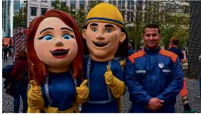
Wie bei Feuerwehrmann Sam: Zum Aktionstag der Feuerwehr begrüßten auch Comic-Brandbekämpfer die Besucher und ließen sich fotografieren.

Besonderes Highlight war die Vorführung einer Feuerfontäne, die zustande kommt, wenn brennendes Fett versucht wird, mit Wasser zu löschen. Große Augen und sichtlich immer mehr Ehrfurcht vor dem Beruf der Lebensretter sind die Folge vor Ort: Lehrreich und äußerst spannend für alle Besucher!