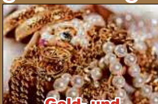
Gold- und Silberschmuck