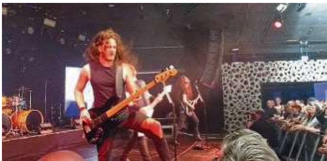
Das Publikum reckt die Hände zu sogenannten „Pommesgabeln“ geformt in die Höhe, die Haare vieler Gäste sind lang. Es wird gegrölt und geschwitzt: Ein großartiges Metalkonzert mit den Coverbands „667 – The Neighbour of the Beast“ (Iron Maiden Tribute aus Fulda, Bild oben) und Sad aus Italien mit Metallica-Liedern gab es am Dienstagabend im Zoom in Fechenheim. Und das hat gerockt – auch mit verschiedenen Verkleidungen und erschreckenden Riesen-Wesen in der Menge. Ein großer Spaß – und der soll in Zukunft öfter zu erleben sein!