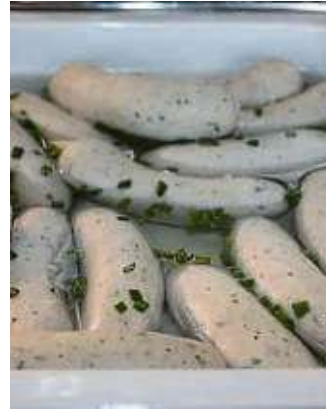
Zur Einstimmung aufs Fest gab es schon mal Weißwurst.