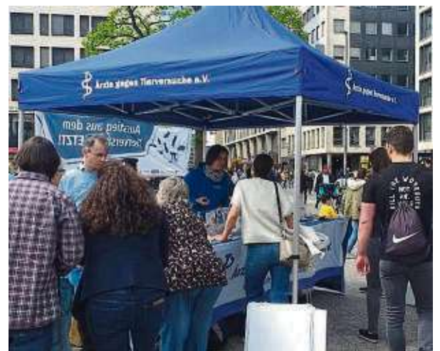
Ordentlicher Andrang: Viele bleiben am Samstag an den Ständen der „Ärzte gegen Tierversuche“ oder von „Animal Liberator Frankfurt“ stehen und lassen sich informieren.