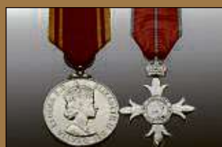
Medaillen / Orden