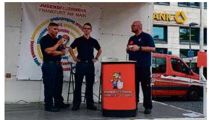
Im Gespräch mit InfraserV gibt es viel Spannendes zu erfahren.