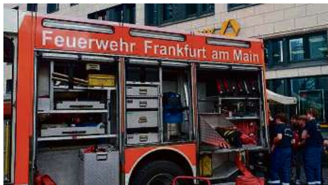
Viel Equipment muss zum Löschen von Bränden immer dabei sein.