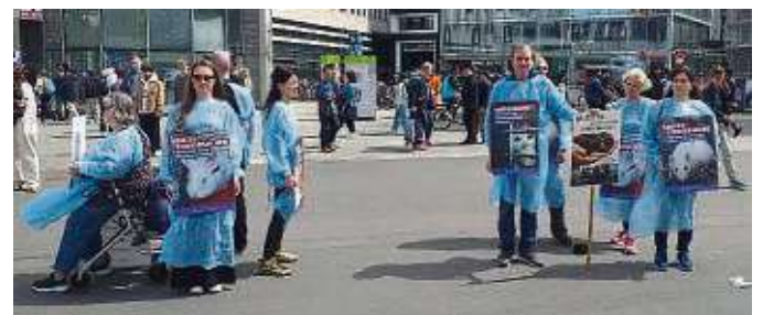
Bei den sogenannten „Silent Lines“ konnten sich auch Passanten einen Kittel nehmen und an der Aktion teilnehmen.