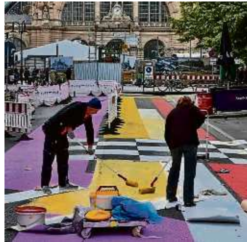
Wegweiser-Pfeile weisen auf wichtige Ziele in der Stadt hin.