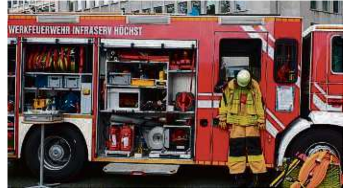
Einblicke in das Innenleben der Feuerwehrfahrzeuge gewährten die Stadtteilwehren den Interessierten am Roßmarkt.