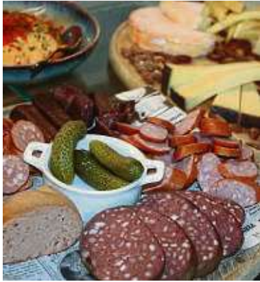
Eine zünftige Brotzeit wird es ab September in der Festhalle Hausmann geben.