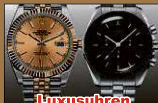
Luxusuhren aller Art