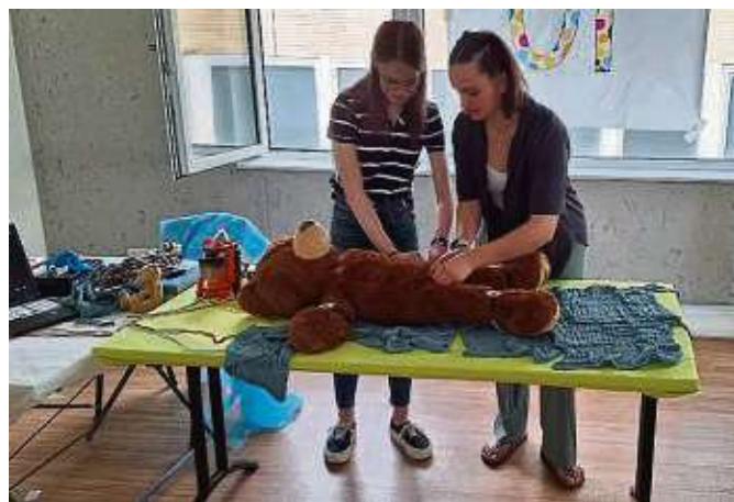
Zwei Studierende bereiten einen Teddy auf seine OP vor.

Das Szenario, das Besuchern, Eltern und Pressevertretern gezeigt wurde, war beeindruckend echt: Um den Kindern ein möglichst authentisches Erlebnis zu zeigen, haben Medizin- und Pharmaziestudierende das KOMM-Studieren-