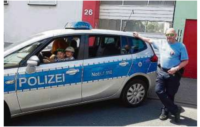
Die Kinder waren davon begeistert, sich einmal hinters Steuer eines Polizeiautos setzen zu dürfen.

Tolle Stimmung beim Triebstraßenfest – Fortsetzung von Seite 1