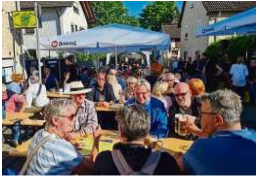
„Schee war’s“, fanden die Besucher des Bachgassefests an Vatertag.

Bergen-Enkheim (red) – Der Einladung des Karnevalvereins Enkheim (KVE) zum traditionellen Bachgassefest rund um sein Vereinsheim „Käwwern Klause“ in Alt Enkheim folgten die Besucher bei tollem Sonnenschein in Scharen. Ab Veranstaltungsbeginn füllte sich die Bachgasse zunehmend. Die Gäste fanden sich zu guten Gesprächen und zum Feiern am Vatertag an den zahlreichen Sitzgelegenheiten ein, genossen kühle Getränke und bedienten sich am reichhaltigen Speisenangebot. Neben den berühmten Nierenspießen war die Pommes-Station mit gegrillten Würstchen sowie selbst gekochter Currysoße dem großen Ansturm gewachsen. DJ Wundi heizte dem Publikum ein. Be-