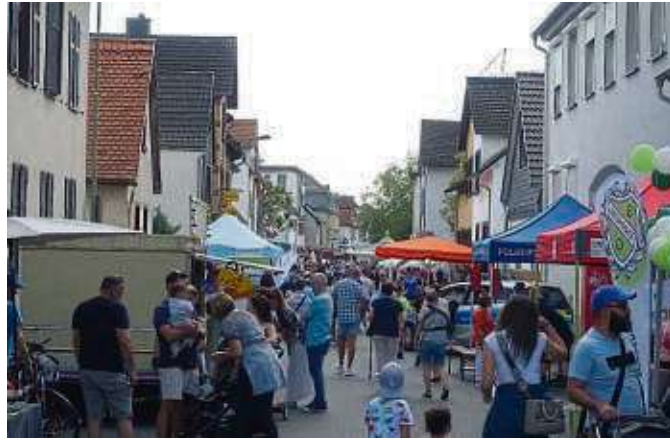
Super Stimmung bei super Wetter: Das Triebstraßenfest lockte am Muttertag viele Besucher an.