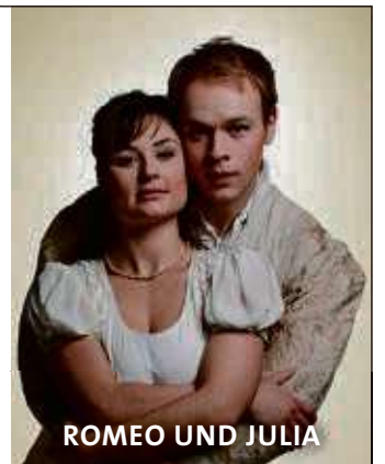
ROMEO UND JULIA