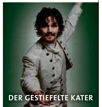
DER GESTIEFELTE KATER

Präsentiert von: Hilf Radio FFH Hanauer Anzeiger