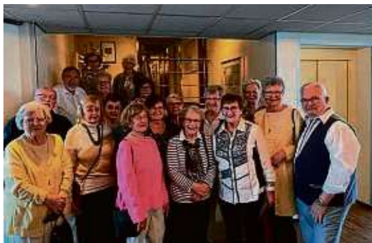
Der Bergen-Enkheimer Verkehrsverein genießt die Kreuzfahrt in den Niederlanden.

Weiter ging es nach Antwerpen. Ein ganzer Tag stand zur Verfügung, um die Diamantenstadt zu erkunden, die im 15. und 16. Jahrhundert als eine der wichtigsten Handelsmetropolen Europas galt und demzufolge sehr wohlhabend war. Außerdem war die Stadt Heimat bekannter