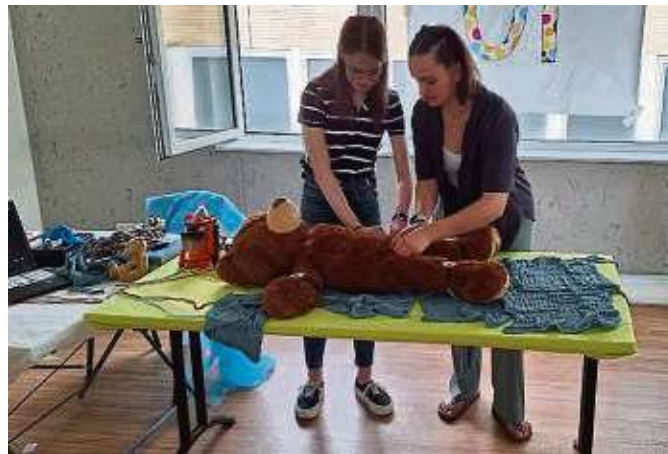
Zwei Studierende bereiten einen Teddy auf seine OP vor.

Das Szenario, das Besuchern, Eltern und Pressevertretern gezeigt wurde, war beeindruckend echt: Um den Kindern ein möglichst authentisches Erlebnis zu zeigen, haben Medizin- und Pharmaziestudierende das KOMM-Studieren-