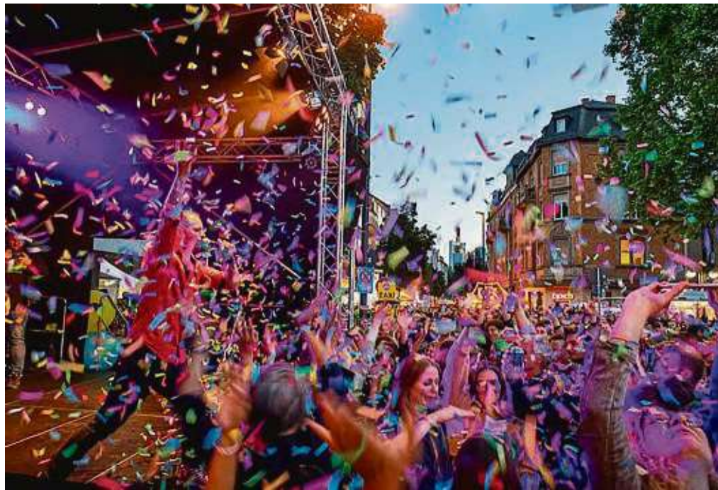
Livemusik, Kulinarik, bunte Buden und eine Demokratie-Arena: Auf der Berger ist mächtig was los.