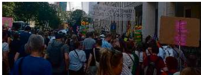
Mit Bannern und Plakaten ausgestattet, tanzten die Teilnehmer mit Sprechgesängen wie „Alerta, alerta, antifascista!“ durch die Innenstadt.