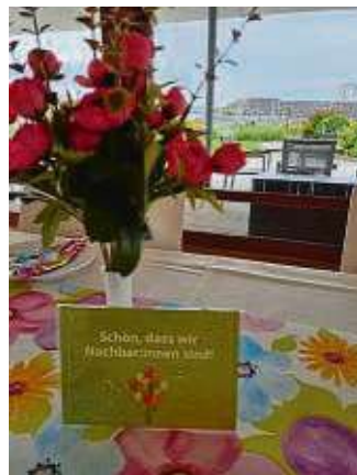
Im Haus Saalburg wurde über den Dächern Bornheims gefeiert.