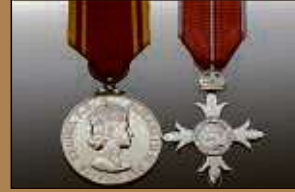
Medaillen / Orden