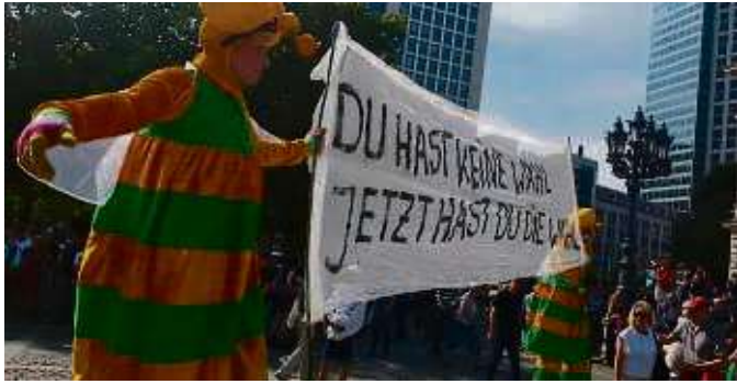
Die fleißigen „Bienen“ im Einsatz gegen den Rechtsruck in Deutschland: Mit einem Banner rufen sie dazu auf, die eigene Wahl-Stimme zu nutzen.