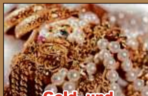
Gold- und Silberschmuck