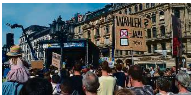
Zu der Kundgebung nach dem Demonstrationszug durch Frankfurt kamen rund 2500 Menschen auf den Platz vor der Alten Oper.