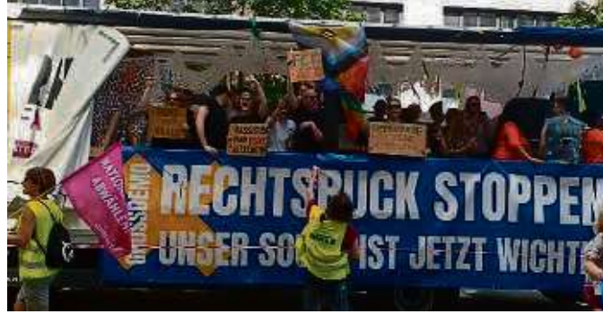
Die Frankfurter Klubs sind mit lauter Musik unterwegs. Etwa das Tanzhaus West motiviert mit elektronischer Musik zum Tanzen für Vielfalt.

Gegen den Rechtsruck auf die Straße: 2500 kommen zur Kundgebung