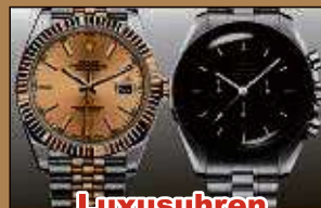
Luxusuhren aller Art