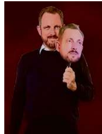
Tartuffe mit Maske: Welches Spiel treibt er?

Das Bockenheimer Theaterensemble bringt die bekannte Komödie „Tartuffe“ von Jean-Baptiste Molière in einer modernen Bearbeitung im Kulturhaus Frankfurt, Pfingstweidstraße 2 (am Zoo) auf die Bühne. Obwohl Molières Satire vor über 400 Jahren uraufgeführt wurde, hat sie nichts von ihrem Biss