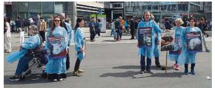
Bei den sogenannten „Silent Lines“ konnten sich auch Passanten einen Kittel nehmen und an der Aktion teilnehmen.

gen und immer Durst. Sie leiden Qualen, die man sich nicht vorstellen kann.“ Für die Wissenschaft seien die Versuche oft nicht vom Tier auf den Menschen übertragbar: „Aber die Empfindungen, die Panik und Angst, die Schmerzen und Qualen, die die Tiere während dessen erleiden, sind vergleichbar“, merkt die Tierärztin an: „Und wenn es ‚nur‘ um Blutabnahme bei einer Maus geht, bei der eine ähnlich große Spritze benutzt wird wie beim Menschen, ist das schon, als würde man uns ein Rohr in den Bauch rammen.“