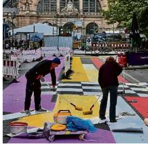
Wegweiser-Pfeile weisen auf wichtige Ziele in der Stadt hin.