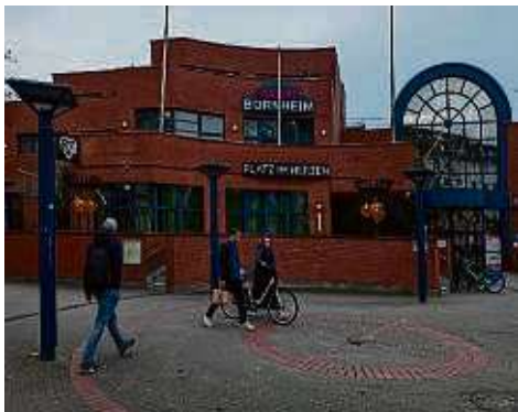
Laut SPD sind die Preise im „Platz im Herzen“ für ein Lokal im Bürgerhaus zu hoch.

Bornheim (bos) – Die Kritik der SPD-Bornheim am Restaurant „Platz im Herzen“ im Bürgerhaus Bornheim reißt nicht ab. Unlängst hat der Ortsverein zwei Pressemitteilungen verschickt, in der er von „katastrophalen Zuständen“ in dem Lokal an der Arnburger Straße spricht. Dessen Geschäftsleitung kann die Vorwürfe nicht nachvollziehen. Frank Junker, der Chef der ABG, deren Tochterunternehmen Saalbau die Räume verpachtet, spricht von einer „Hexenjagd“ gegen das Lokal.