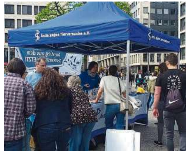
Ordentlicher Andrang: Viele bleiben am Samstag an den Ständen der „Ärzte gegen Tierversuche“ oder von „Animal Liberators Frankfurt“ stehen und lassen sich informieren.