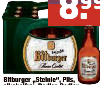
Bitburger „Steinie“, Pils, alkoholfrei, Radler, Radler alkoholfrei 20 x 0,33 I-Fl., Pfd. 3,10 € 1,36/l