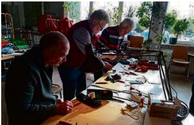
Die Reparatur-Spezialisten vom Repaircafé in der Tafel nehmen sich Zeit für die Behandlung von Geräten.

HATTERSHEIM (red) – Am Samstag, 3. Februar, findet wieder das Repaircafé in der Tafel Hattersheim-Hofheim des Caritasverbandes Main-Taunus e.V. statt. Von 10 bis 12 Uhr wird sich das Team in den Räumen Im Boden 6 der defekten Gerätschaften, die „man alleine tragen kann“ (außer Fahrrädern), annehmen. Was vor Ort repariert werden kann, wird natürlich auch gleich von den fachkundigen und geduligen Reparaturexperten liebevoll und kostenlos „behandelt“. Die Untersuchung und die Reparatur kosten nichts. Nur Ersatzteile, die gebraucht werden, müsste der Eigentümer selbst bestellen und bezahlen. Übrigens: Das Team vom Re-