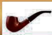
Münzen / Pfeifen