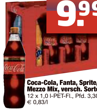
Coca-Cola, Fanta, Sprite, Mezzo Mix, versch. Sorten 12 x 1,0 I-PET-Fl., Pfd. 3,30 € 0,83/l