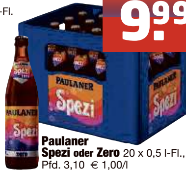
Paulaner Spezi oder Zero 20 x 0,5 I-Fl., Pfd. 3,10 € 1,00/l