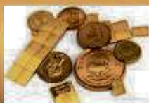
Münzen / Barren