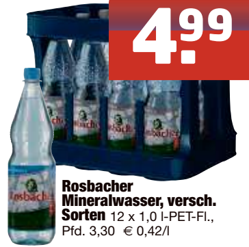
Rosbacher Mineralwasser, versch. Sorten 12 x 1,0 I-PET-Fl., Pfd. 3,30 € 0,42/l