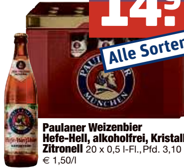
Paulaner Weizenbier Hefe-Hell, alkoholfrei, Kristall, Zitronell 20 x 0,5 I-Fl., Pfd. 3,10 € 1,50/l