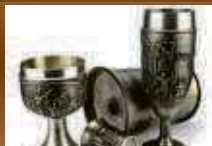
Zinn / Platin