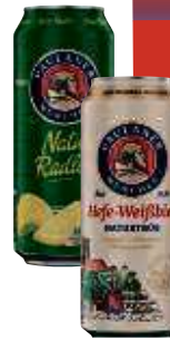
Paulaner Hefe-Weißbier naturtrüb, Natur Radler, Natur Radler alkoholfrei 0,5 I-Dose, Pfd. 0,25 € 1,58/l