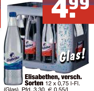
Elisabethen, versch. Sorten 12 x 0,75 I-Fl. (Glas), Pfd. 3,30 € 0,55/l

Irrtum vorbehalten KW 05/24 - Gültig vom Mo. 29.1. bis Sa. 3.2.24. Diese Preise gelten nur bei Abholung in unseren Getränkemärkten in Sulzbach und Kelkheim. Solange der Vorrat reicht.