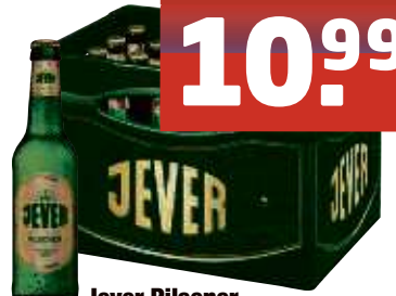
Jever Pilsener, Fun, Light 20 x 0,5 I-Fl., Pfd. 3,10 € 1,10/l Pils 24 x 0,33 I-Fl., Pfd. 3,42 € 1,39/l