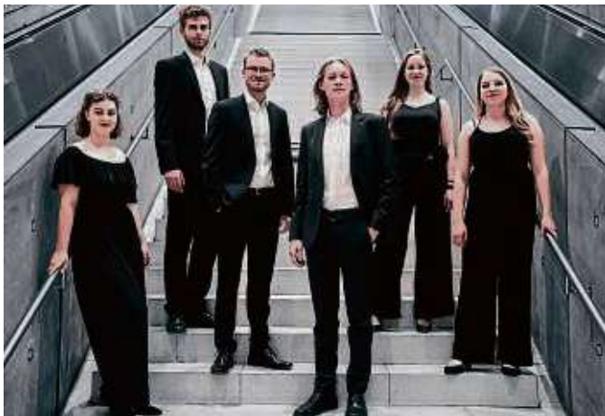
voicemade bietet Begegnung(en) der vokalen Art.

ESCHBORN (red) – Mit dem A-cappella-Konzert von voicemade am Sonntag, 3. März, 19 Uhr in der Stadthalle geht die Konzertsaison glanzvoll zu Ende. Unter dem Titel „Rendezvous - Begegnung(en) der vokalen Art“ stehen unter anderem Werke von Poulenc, Stenhammar, Bernstein und Queen auf dem Programm. Das vielfältige Repertoire reicht von geistlichen Werken der Renaissance und barocken Motetten, romantischen Werken bis hin zu Kompositionen des 20. und 21. Jahrhunderts. Auf das Publikum wartet ein musikalisch abwechslungsreiches Konzert mit herausragender klanglicher Homogenität. Karten für 15 Euro gibt es unter www.frankfurtticket.de .