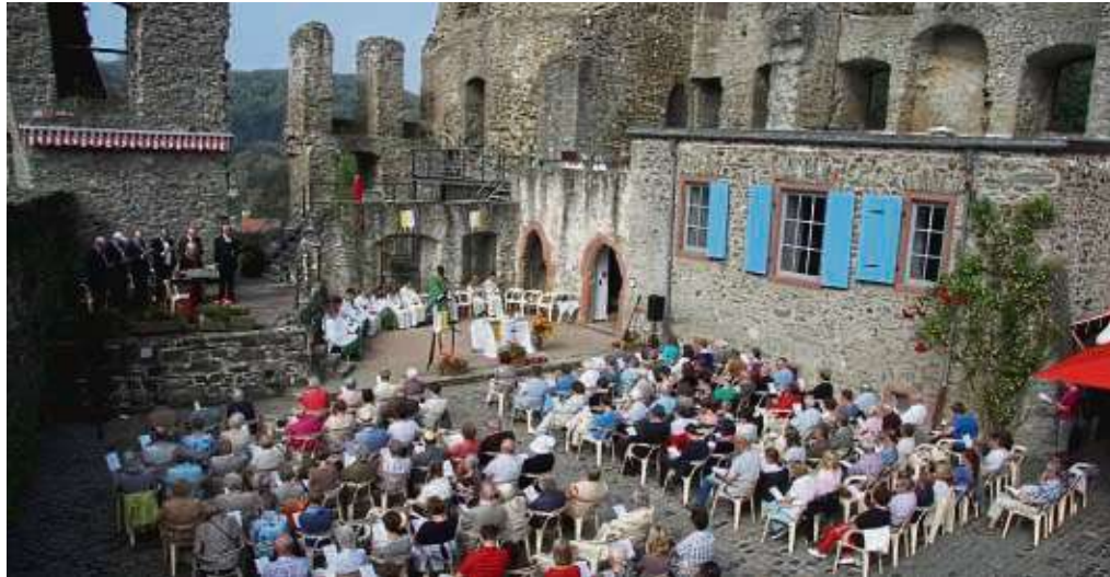
Seit 111 Jahren ist die Eppsteiner Burg schon ein Ort für besondere Aufführungen.

HATTERSHEIM (red) – Ein Kleidungsstück selbst herzustellen lernen Kinder von acht bis zwölf Jahren bei einem Nähkurs in Neli's Atelier (Am Kirchgarten 6) vom 23. April bis zum 9. Juli an zwölf Kurstagen jeweils von 16 bis 18 Uhr. Der Kurs kostet 96 Euro plus Materialkosten. Wer keine eigene Nähmaschine besitzt, kann sich gegen eine geringe Gebühr eine Maschine leihen. Anmeldung unter ☎ 06190 979156, per E-Mail an vfvhattersheim@gmx.de oder in der Geschäftsstelle des Vereins für Volksbildung (Am Markt 7).