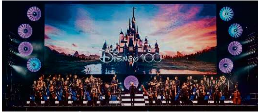
Durch die Darbietung der Filmszenen auf großer Leinwand wird das multimediale Live-Erlebnis zu einem fantastischen Abenteuer.

FRANKFURT/TAUNUS (red) – Was einmal mit einer kleinen Maus begann, hat sich zu einer faszinierenden Welt aus einzigartigen Disney-Geschichten und unverwechselbaren Melodien entwickelt, die generationenübergreifend Erinnerungen wecken. Disney in Concert taucht 2024 zum sechsten Mal in den musikalischen Kosmos von Disney ein und verspricht ein zauberhaftes Live-Erlebnis. Am 24. April um 20 Uhr gastiert das Ensemble in der Frankfurter Festhalle erneut in einer herausragenden Besetzung. Gemeinsam mit dem Hollywood-Sound-Orchestra unter der Leitung von Wilhelm Keitel begeben sich die Starsolistinnen und Starsolisten auf eine einzigartige Reise durch die erfolgreichsten Lieder der schönsten Disney-Filme wie „Encanto“, „Cinderella“, „Coco“, „Mulan“ oder „Rapunzel – Neu verföhnt“. Durch die überwältigende Darbietung der Filmszenen auf großer Leinwand wird das multimediale