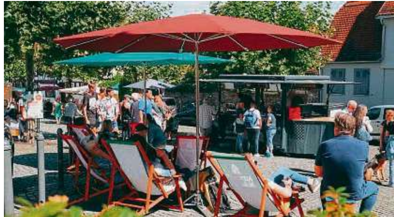
Der Altstadtmarkt bietet Zeit zu entspannen.