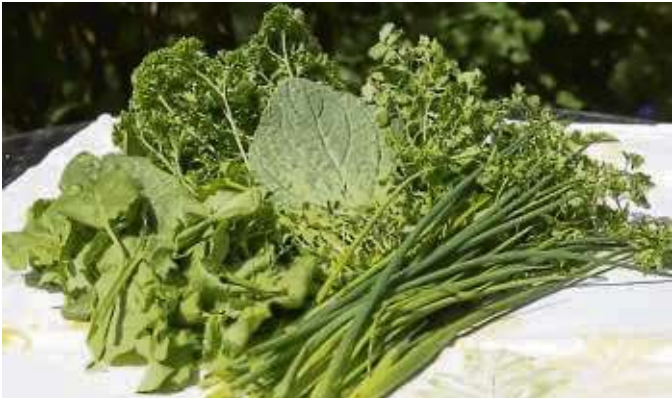
Die sieben Kräuter auf einen Blick: Petersilie, Schnittlauch, Sauerampfer, Borretsch, Kresse, Kerbel und Pimpinelle

wahl steht ebenfalls zur Verfügung. Am Ende des Abends werden die Abstimmkarten gezückt und das Publikum wählt den Abendsieger. Die sieben Abendsieger treten am achten Tag im