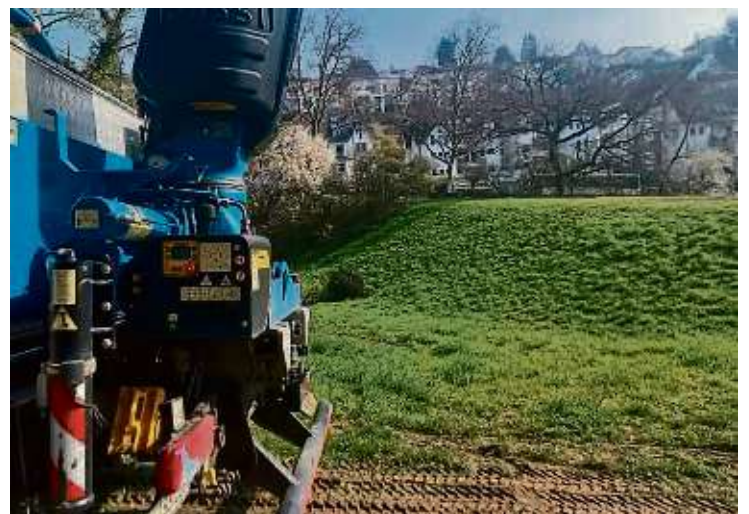
Läuft alles nach Plan, starten am Niederdorfsbach im kommenden Jahr die Arbeiten zur Erweiterung des Rückhaltebeckens.

nigsteiner Straße zwischen der Kernstadt und Neuenhain. Das dortige Regenrückhaltebecken soll deutlich erweitert werden und