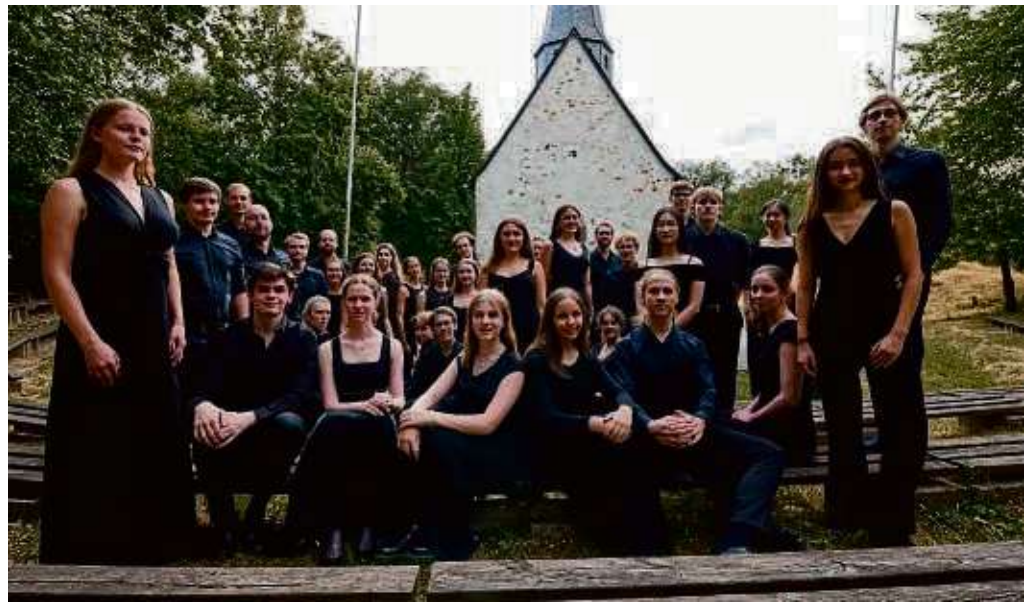
Der Jugendchor Hochtaunus vor seinem Konzert im Freilichtmuseum Hessenpark im vergangenen Jahr.

Die Probenphase des Jugendchors liegt in diesem Jahr erstmals am Ende der Sommerferien: Vom 17. bis zum 24. August versammeln sich die Sängerinnen und Sänger in der Jugendherberge Oberreifenberg. Am Ende sind dann mehrere öffentliche Konzerte geplant, deren Termine sich alle Musikbegeisterte im Taunus bereits vor-