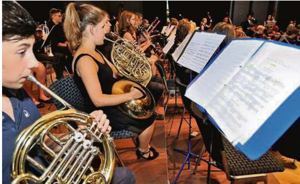
Das Konzert des Jugendsinfonieorchesters (hier ein älterer Jahrgang) findet am 24. August statt.

TAUNUS (red) – Im Zuge des Ausbaus der Regionaltangente West (RTW) entfallen die Züge der RB 11 bis auf Weiteres. Für Fahrgäste wurde ein Schienenersatzverkehr (SEV) eingerichtet. Der geänderte Fahrplan ist in der RMV-Verbindungsauskunft berücksichtigt und steht als PDF unter www.start-taunus.com zum Download bereit.