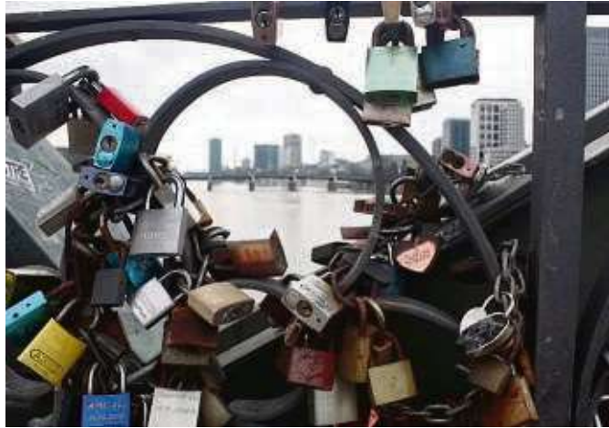
Unzählige Schlösser für die Liebe hängen am Eisernen Steg, die Paare gemeinsam angebracht haben. Vielleicht ja auch Ihres?

Wir suchen Anekdoten und Geschichten, Hintergründe und Informationen dazu, wie es mit Paaren weitergegangen ist, die über dem Main öffentlich an ihre Liebe geglaubt und diese damit „fest geschlossen“ haben. Wer uns seine Geschichte erzählen möchte, vielleicht auch Fotos von sich oder/und dem angebrachten Liebeschloss hat, sendet das Material mit Angabe des Wohnorts gerne per Mail bis 12. April an redaktion@frankfurter-wochenblatt.de. Interessant sind alle Geschichten; ob geheiratet wurde, Kinder hervorgegangen sind, ausgewandert wurde, die Verbindung in die Brüche ging