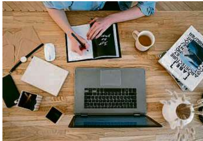
Das Frühjahrsprogramm der Veranstaltungsreihe Frau & Job umfasst 16 Angebote in unterschiedlichen Formaten.

Der Online-Vortrag „Frauen und Rente“ in Kooperation mit der Deutschen Rentenversicherung wird bewusst kostenfrei angeboten, um möglichst viele Interessierte für das Thema zu gewinnen. Ein weiterer Vortrag richtet sich gezielt an jüngere Frauen und beantwortet die Frage, warum es so wichtig ist,