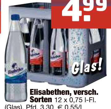
Elisabethen, versch. Sorten 12 x 0,75 I-Fl. (Glas), Pfd. 3,30 € 0,55/l

Irrtum vorbehalten KW 05/24 - Gültig vom Mo. 29.1. bis Sa. 3.2.24. Diese Preise gelten nur bei Abholung in unseren Getränkemärkten in Sulzbach und Kelkheim. Solange der Vorrat reicht.