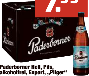
Paderborner Hell, Pils, alkoholfrei, Export, „Pilger“ 20 x 0,5 I-Fl., Pfd. 3,10 € 0,80/l