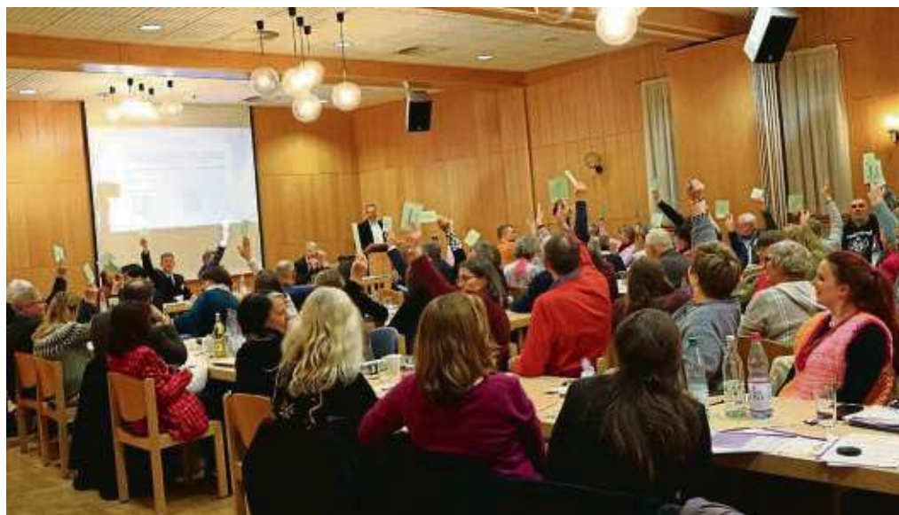
Die Vertreter der 30 Gemeinden des Dekanats Kronberg trafen sich zur Frühjahrssynode in Diedenbergen.

Der Kurs beginnt am 7. März und umfasst insgesamt zehn Einheiten jeweils donnerstags von 18.30 bis 20 Uhr. Infos und Anmeldung per E-Mail an Heidi.koch@bw-schneidhain.de oder unter www.bw-schneidhain.de/Line .