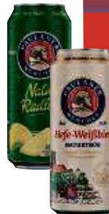
Paulaner Hefe-Weißbier naturtrüb, Natur Radler, Natur Radler alkoholfrei 0,5 I-Dose, Pfd. 0,25 € 1,58/l