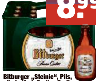
Bitburger „Steinie“, Pils, alkoholfrei, Radler, Radler alkoholfrei 20 x 0,33 I-Fl., Pfd. 3,10 € 1,36/l