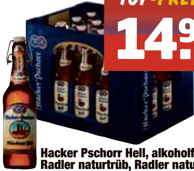
Hacker Pschorr Hell, alkoholfrei, Radler naturtrüb, Radler naturtrüb alkoholfrei 20 x 0,5 I-Fl., Pfd. 4,50 € 1,50/l Hell 20 x 0,33 I-Fl., Pfd. 4,50 € 2,27/l