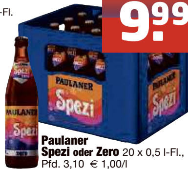
Paulaner Spezi oder Zero 20 x 0,5 I-Fl., Pfd. 3,10 € 1,00/l