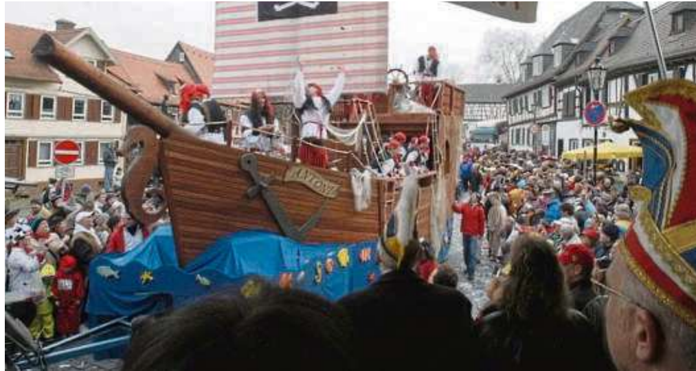
Der Bommersheimer Ski-Club leistet immer einen sehenswerten Beitrag zum Taunus-Karnevalszug, wie unser Archivfoto beweist.

SULZBACH (red) – Für Donnerstag, 15. Februar, 18 Uhr laden die Landfrauen zum Heringessen in das Schützenhaus in der Bad Sodener Straße 28 ein. Alternativ zum Fisch wird ein Fleischgericht angeboten. Die Kosten für Speisen und Getränke sind selbst zu tragen. Es wird auch wieder eine Schützenkönigin ermittelt. Anmeldung bitte bis zum 9. Februar bei Dagmar Ewald unter ☎ 0179 6907134 oder per E-Mail an dagmarewald@me.com.