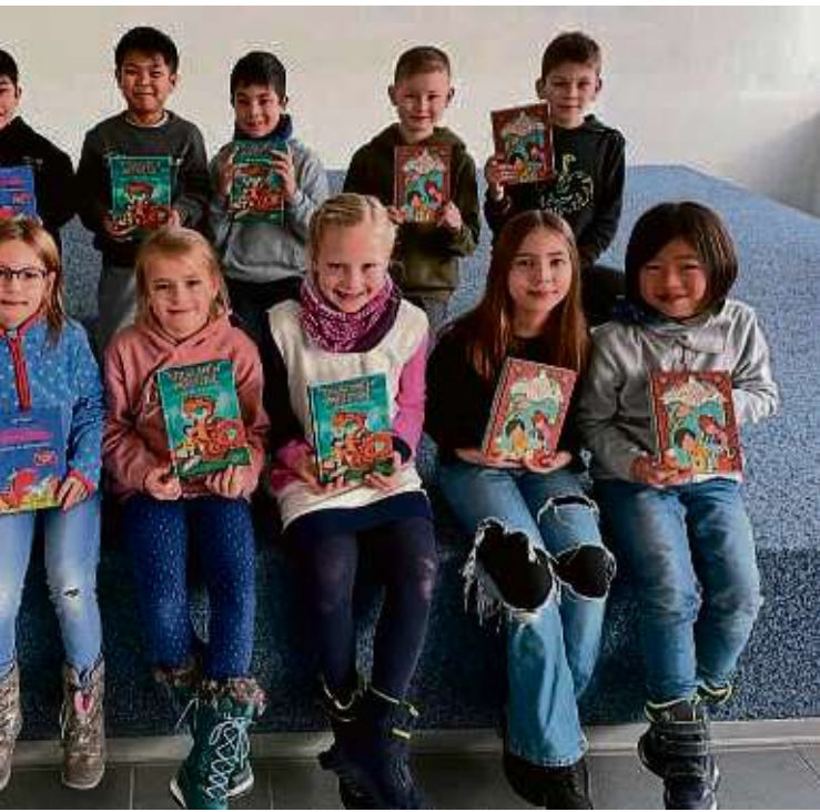
Westerbach-Schule in Niederhöchstadt überraschte der Lions Club Eschborn mit

weise ihre Lieblingsstellen vorlesen und sich durch verschiedene Aufgaben näher mit Literatur be-