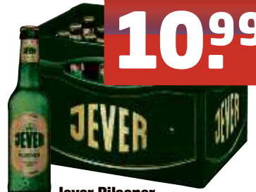
Jever Pilsener, Fun, Light 20 x 0,5 I-Fl., Pfd. 3,10 € 1,10/l Pils 24 x 0,33 I-Fl., Pfd. 3,42 € 1,39/l