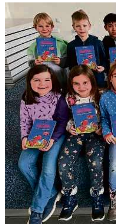
Die Schülerinnen und Schüler der Westerbach-Schule mit ihren neuen Büchern.

In der Leseprojektwoche vor den Weihnachtsferien verwendeten die Lehrkräfte die Bücher als Grundlage für verschiedene Aktivitäten. Die Schüler konnten sich