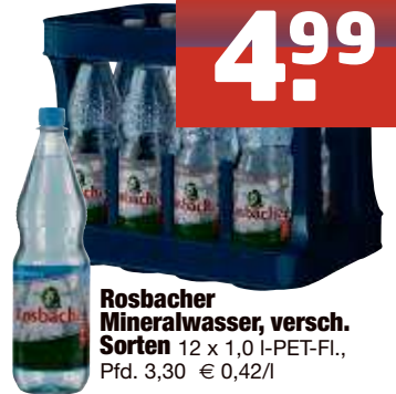
Rosbacher Mineralwasser, versch. Sorten 12 x 1,0 I-PET-Fl., Pfd. 3,30 € 0,42/l