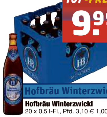
Hofbräu Winterzwickl! 20 x 0,5 I-Fl., Pfd. 3,10 € 1,00/l