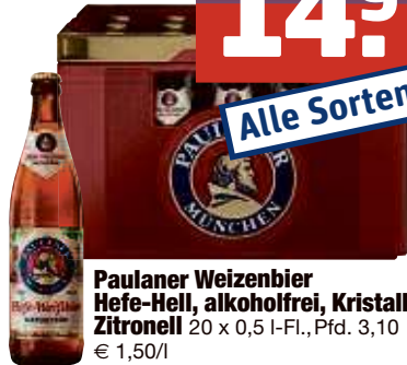
Paulaner Weizenbier Hefe-Hell, alkoholfrei, Kristall, Zitronell 20 x 0,5 I-Fl., Pfd. 3,10 € 1,50/l