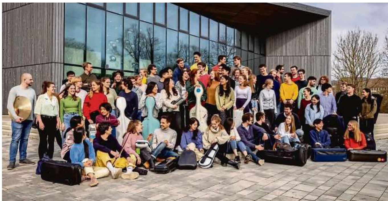
Das Gesamtensemble der Jungen Deutschen Philharmonie

Die Online-Anmeldung auf der Homepage der Stadt ( www.bad-homburg.de ) ist am Mittwoch gestartet. Die Osterferienspiele finden vom 2. bis 12. April am Peter-Schall-Haus statt. Angeboten werden Spiele, Basteln und Toben, die Kosten belaufen sich auf 130 Euro. Weitere Infos gibt es beim Fachdienst Kinder- und Jugendförderung unter ☎ 06172 100-5004 sowie auf der Homepage.