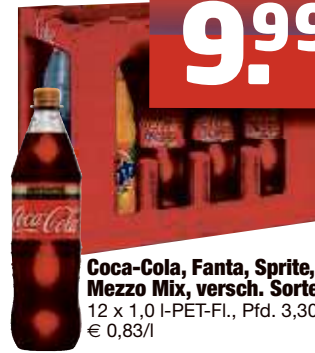
Coca-Cola, Fanta, Sprite, Mezzo Mix, versch. Sorten 12 x 1,0 I-PET-Fl., Pfd. 3,30 € 0,83/l