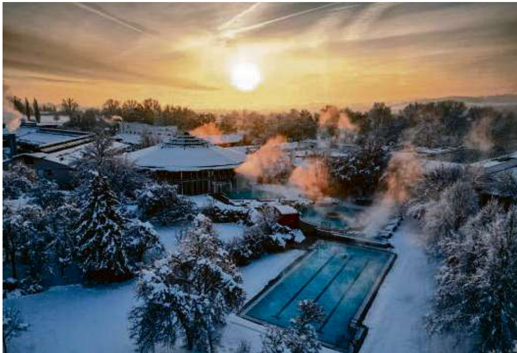
Besonders im Winter ein Genuss: Bei Minusgraden im wohlig warmen Heilwasser der Rottal Terme entspannen

Bad Birnbach. Im südöstlichen Niederbayern, zwischen Donau, Rott und Inn, pulsiert seit 50 Jahren unermüdlich dampfend heißes Heilwasser aus den Tiefen des Urgesteins. Genau hier liegt Bad Birnbach, das ländliche Bad. Ein Blick zurück: Viele Menschen versammelten sich damals an einem Bohrloch inmitten einer grünen Wiese. Langsam trat heißes, dampfendes Wasser aus der Erde, nachdem ein Bohrkopf bis in 1.618 Meter Tiefe des Urgesteins vorgebracht war und auf 70 Grad heißes und hoch mineralisiertes Thermalwasser stieß. Dieser Tag markierte den Beginn einer Erfolgsgeschichte, die noch heute andauert: Es war die Geburtsstunde des ländlichen Bades. Die Quelle wurde nach dem Ortsheiligen Chrysantus getauft. Der heilende Effekt wurde längst wissenschaftlich durch Prof. Dr. Heinrich Drexel vom Institut für medizinische Balneologie und Klimatologie der Universität München verbrieft. Fünf Jahrzehnte nach dem Fund weist die Rottal Terme mehr als 30 Becken mit einer Fläche