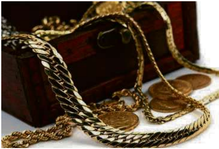
Goldschmuck und Goldmünzen

Experten für Schmuck, Diamanten, Luxusuhren und Bernstein vom 22.04. – 27.04.2024 zu Gast bei Scheurenbrand & Seiler in Bad Homburg