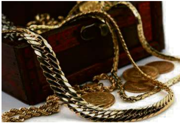
Goldschmuck und Goldmünzen

Experten für Schmuck, Diamanten, Luxusuhren und Bernstein vom 22. - 27. April 2024 zu Gast bei Juwelier Fehn in Kronberg