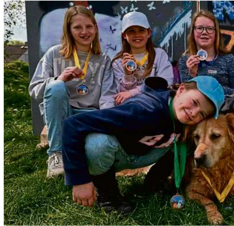
Zum Abschluss ihres Abenteuers auf 4 Pfoten gab es für die Kinder Medaillen

SCHWALBACH (red) – Einer Frau ist am vergangenen Samstag in der Pommernstraße die Handtasche gestohlen worden. Wie die Polizei berichtet, kam der bislang noch unbekannte Täter der Frau gegen 18 Uhr entgegen. Beim Vorbeigehen entriß er ihr dann plötzlich die Tasche und flüchtete. Die Polizei leitete sofort eine Fahndung ein, konnte den Handtaschen-dieb allerdings nicht mehr erwischen. Den Angaben nach handelt es sich bei dem Täter um einen etwa 14 oder 15 Jahre alten, etwa 1,80 Meter großen männlichen Jugendlichen. Er war dunkel gekleidet, trug Jeans, einen Kapuzenpullover sowie dunkle Turnschuhe. Zeugen werden gebeten, sich bei der Polizeistation Eschborn unter ☎ 06196 9695-0 zu melden.