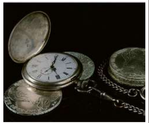
Taschenuhr und Silbermünzen

Bares für Wa(h)res bei Scheurenbrand & Seiler Louisenstraße 48 61348 Bad Homburg Tel. 06172-8 56 99 57