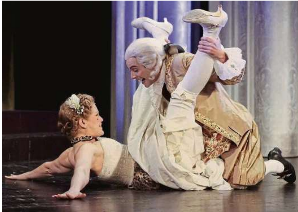
Wolfgang Amadeus Mozart beim Bodenkampf mit Ehefrau Constanze.

Anzeigenpreis nach Preisliste 63 vom 1. 1. 2024 Falls Sie diese Zeitung nicht mehr erhalten möchten, bitten wir Sie einen Werbeaufkleber mit dem Zusatzhinweis „bitte keine kostenlosen Zeitungen“ an Ihrem Briefkasten anzubringen. Ideal wäre auch ein Hinweis unter Angabe Ihrer Anschrift auf www.frankfurter-wochenblatt.de unter dem Reiter Zustellung, damit wir unsere Träger informieren können.