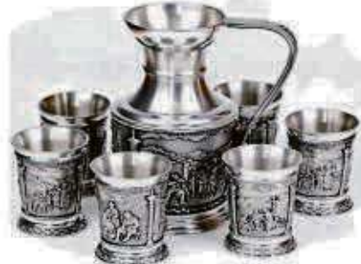
Zinnkrug und Zinnbecher

gestempelt, könnte sich jetzt Bernsteinschmuck als große finanzielle Überraschung entpuppen. Für besonders schöne Honigbersteinketten, im Idealfall in Oliven- oder Kugelform, kann man schon mit ein paar Hundert bis zu mehreren Tausend Euro rechnen. Aufgrund der stark wachsenden Nachfrage aus dem Ausland hat sich der Preis für besonders schöne Stücke in den