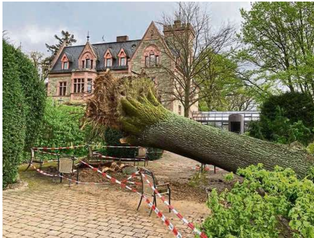
Ein trauriger Anblick: Der Sturm hat am vergangenen Montagabend die 250 Jahre alte Eiche mit einem Durchmesser von 1,50 Meter vor dem Schlosshotel Rettershof in Kelkheim zum Entwurzeln gebracht. Es war durch ein Gutachten bekannt, dass der Wurzelstock von einem Pilz befallen ist. Kurz vor der Beauftragung der Anbringung von Stahlseilen und weiterer Maßnahmen ist die Natur der Verwaltung zuvorgekommen. Glücklicherweise ist die Eiche „günstig“ gefallen. Sie hat lediglich leichte Schäden am Bienenhaus verursacht.