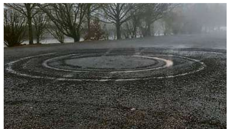
Gerade saniert und wieder zerstört: Eine unbekannte Person hat den frisch sanierten Festplatz in Bremthal beschädigt.