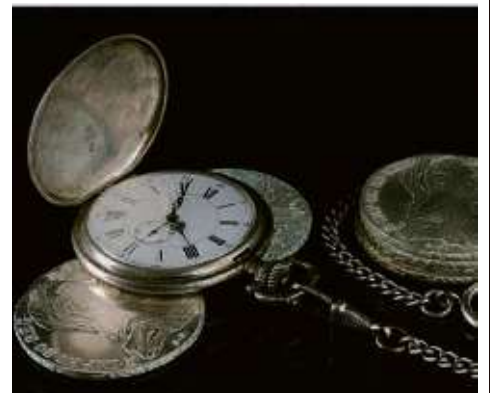
Taschenuhr und Silbermünzen

Bares für Wa(h)res bei Juwelier Fehn Friedrich-Ebert-Straße 14 61476 Kronberg Tel. 06173 1022