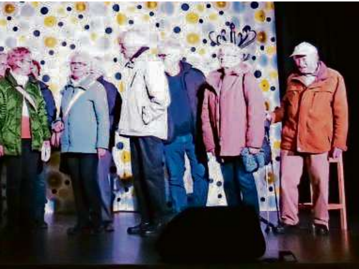
Arbeitsgruppe des Kulturforums Kriftel, um gemeinsam aktuellen Jahr etwas Besonderes überlegt: Treffpunkt war das Gemeinde. Dabei ging es darum, die richtige Antwort auf dem Kaffeetrinken war dann das Showspielhaus. Dort Gruppe und die nächsten Termine erfahren Interessierte