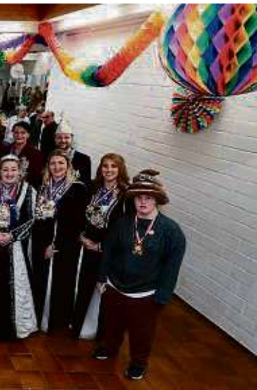
reis traditionell ein Stelldichein in den