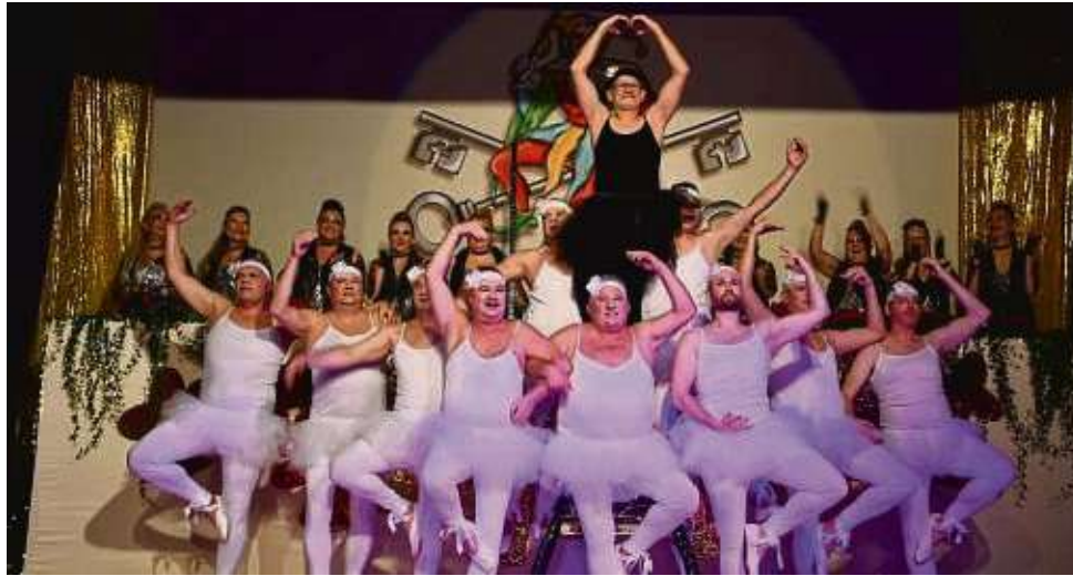
Sorgten für ganze besondere Eleganz bei der Sitzung der Ranzengarde Bürgel: Das Männerballett der Elfer tanzte in seinen Tüll-Tutus seine eigene Interpretation von Schwanensee.