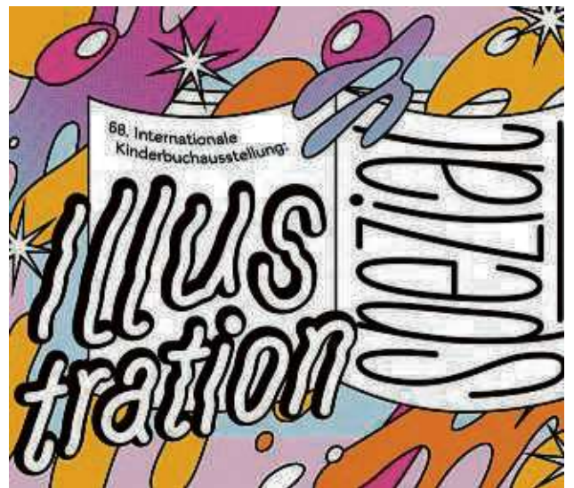
Die 68. Internationale Kinderbuchausstellung im Klingspor Museum ist bis zum 14. April zu sehen.