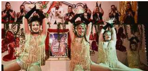
Mit ihrem Schautanz zog die Tanzsportabteilung der Raga Publikum und Elferrat (hinten) in den Bann.