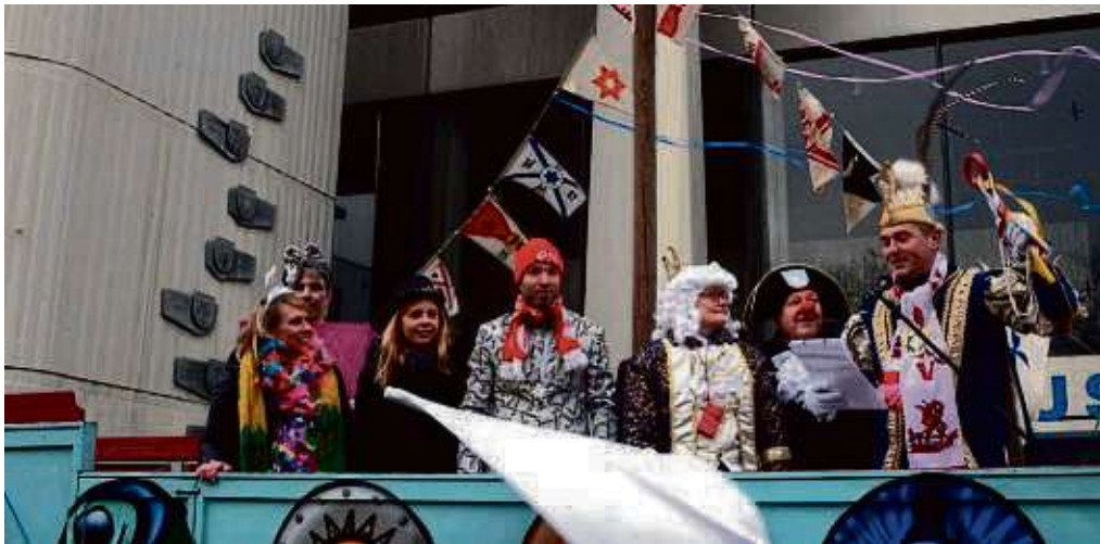
Die Besatzung des Beamtenschiffs hat ohne Kapitän kapituliert: Bis zum Rosenmontag wird das Rathaus von den Narren regiert.