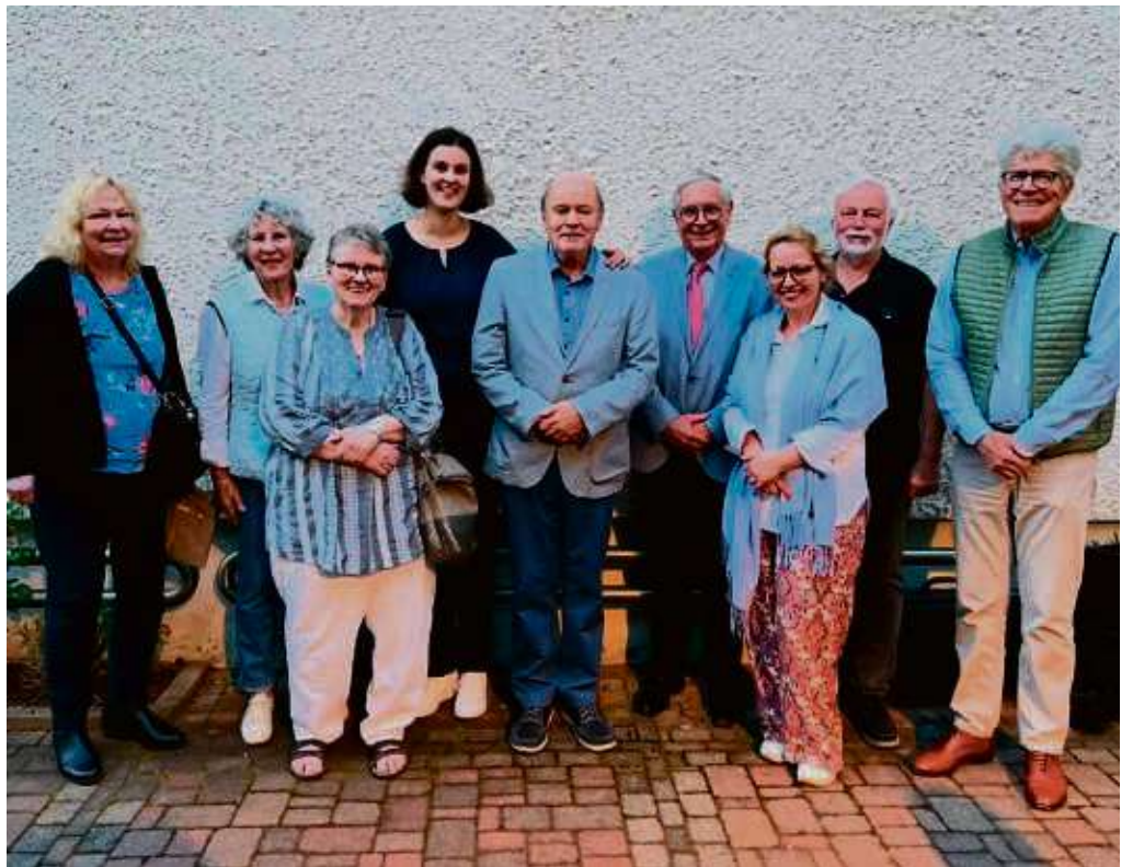
Die Initiative ist mittlerweile ein Verein: Bei der jüngsten Mitgliederversammlung wurde der Vorstand neu gewählt.