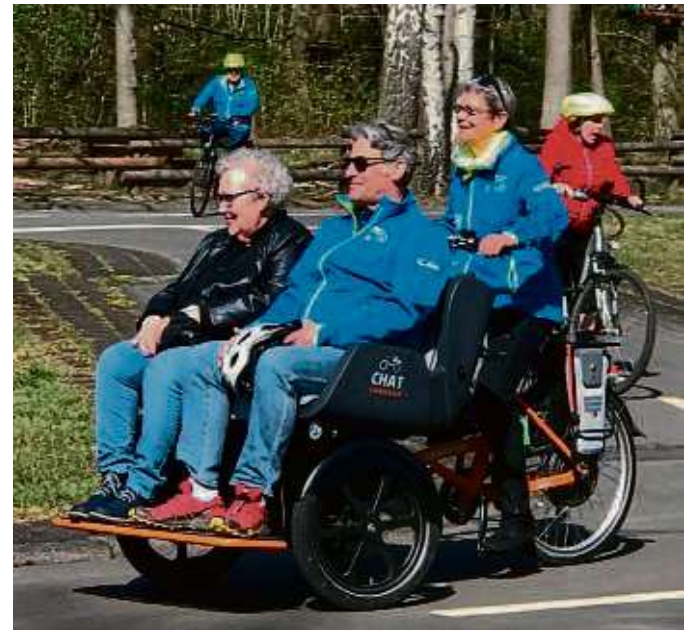
Mit Spaß bei der Sache: Rikscha-Fahren ist sowohl für die Piloten als auch für die Fahrgäste ein Erlebnis.

des Freiwilligenzentrums würde sich über weitere Verstärkung durch engagierte Piloten freuen. Interessierte erhalten eine kleine Schulung. Wer Lust auf einen Schnuppertermin hat, meldet sich per E-Mail an: rikscha@fzof.de