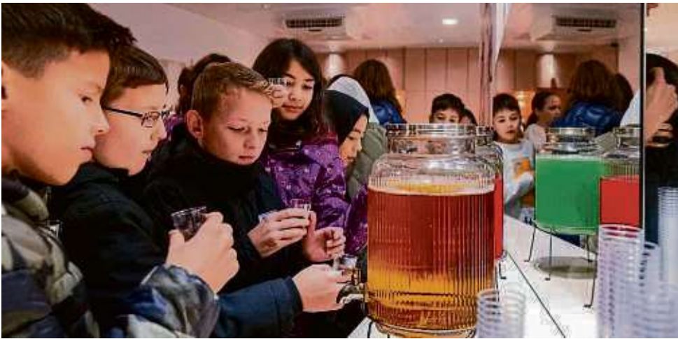
Auch für Schüler bietet das „Diamant“ interdisziplinäre Workshops an.

☎ 06102/3719973 | info@solar-spectrum.de | www.solar-spectrum.de