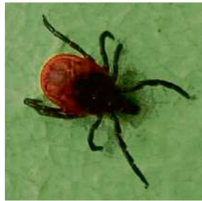
Ob Zange, Karte oder Haken: Es gibt allerlei Werkzeug, um Zecken zu entfernen.

Es sollte sichergestellt sein, dass die Zecke sicher abgetötet wird. Dazu eignet sich die