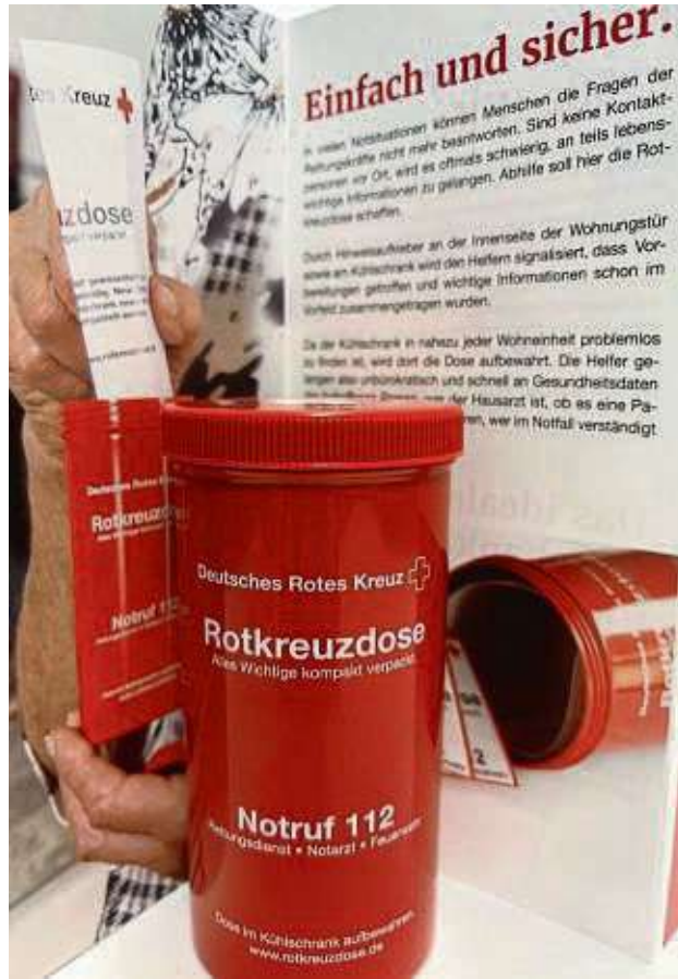
Die Dosen, die Leben retten können.