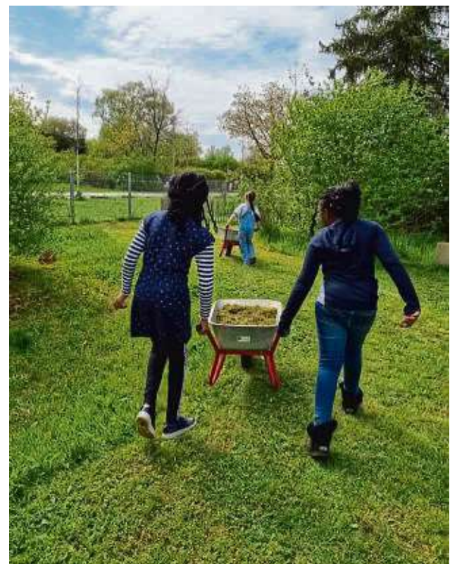
Kräftig anpacken auf dem Buchhügel: Der Farmbetrieb startet am Freitag, 1. März.

Neu sind spezielle Angebote für Erwachsene, beispielsweise Ehrenamtstreffen auf dem Gelände am 15. März, 7. Juni, 30. August und 4. Oktober. Bei der Gelegenheit können sich neue Interessenten in die vielfältige Arbeit einbringen. Für den Sommer schließlich ist ein Frauenabend am Freitag, 21. Juni, geplant. mk