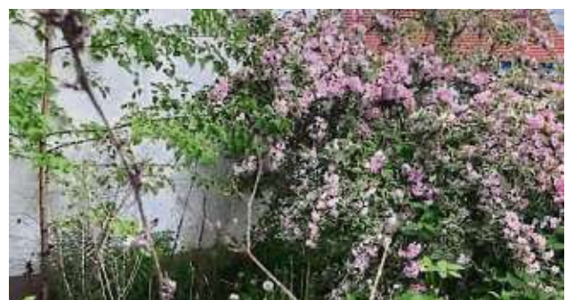
Der Pfarrgarten am St. Markus-Gemeindezentrum soll am 9. März auf Vordermann gebracht werden.