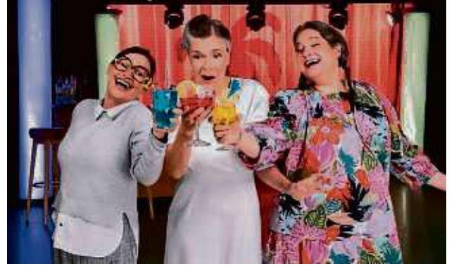
Drei Mädels in Partylaune, kombiniert mit einem bunten Mix aus bekannten Songs: das verspricht die Musikkomödie „Weiber“.

Musikkomödie „Weiber“ kommt nach Offenbach