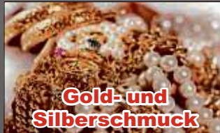
Gold- und Silberschmuck