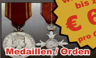
Medaillen / Orden