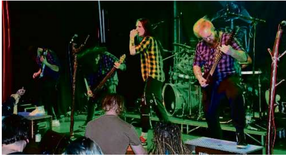
Die aus Offenbach stammende Band Corbian stellte bei der Metal-Night im Schanz ihr neues Album vor. Sie waren der Hauptact des Abends, der von vier Bands gestaltet wurde.