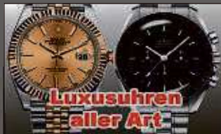
Luxusuhren aller Art

Ihre Vorteile kostenlose Beratung kostenlose Wertschätzung transparente Abwicklung Bargeld sofort