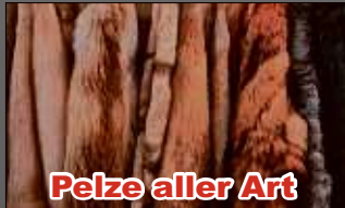
Pelze aller Art