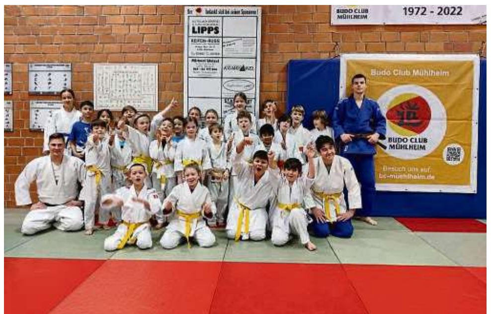
Insgesamt 48 erfolgreiche Kyu-Prüfungen, vom weiß-gelben bis zum braunen Gürtel, wurden beim Budo-Club Mühlheim zuletzt erfolgreich bestanden.

Informationen zu den Angeboten des Budo-Clubs finden Interessierte auf der Website des Vereins: www.bc-muehlheim.de did