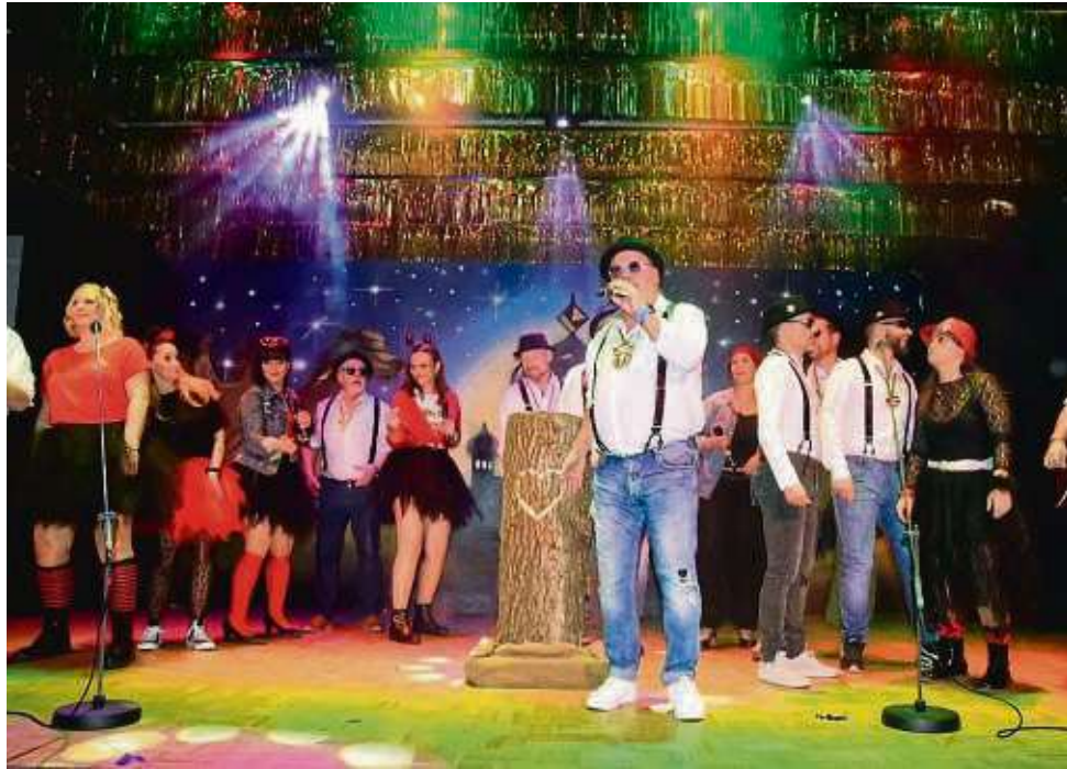
Die Gesangsgruppe „Wurzelwerk“ kommentierte auf ihre Weise heiter-ironisch das aktuelle Geschehen und ertete dafür viel Applaus.

Mit der Parole „Diddesem first“ (für Neu- und Nicht-Hessen: Dietesheim zuerst!) zielte er auf die Despoten dieser Tage, kritisierte fehlgeleitete Hilfsgelder und Attacken gegen Hilfskräfte. Auch gegen Klimakleber, deren Bapp im Winter nicht haften, gebe es „genug Gesetze, wir brauchen keine eigenen Experten, keine neue Partei“. Der Mühlheimer Bürgermeisterwahl kreidete er die schwache Beteiligung an, den Verantwortlichen, dass die Offenbacher Straße immer noch improvisiert einspurig