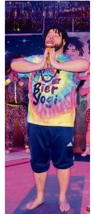
Die Dalles Cowboys üben sich im Bier-Yoga.

Gute Laune mit viel Musik verbreiteten auch die Gruppen Stereotones und Wurzelwerk vor und nach der Pause.