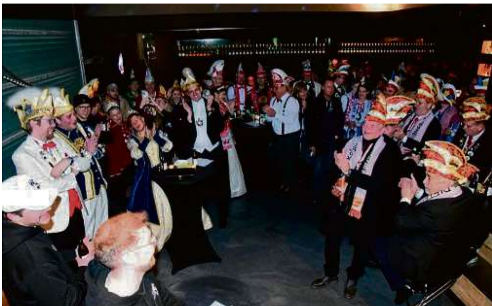
Der noch junge Karnevalclub Abriss (KCA) hatte Narrenvereine aus der Region zu einem Empfang eingeladen. Vertreter von acht Vereinen nahmen die Einladung gerne an.

Angebote sind gültig: 08.02. – 14.02.2024