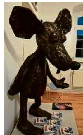
Auch als Skulptur macht die Ratte Ludwig eine gute Figur, zu sehen im „Museum of Modern Rats“.

Die Ausstellung „Ludwig und Konsorten“ ist bis zum 10. März sonntags von 11 bis 16 Uhr geöffnet, die Künstlerin ist stets anwesend.