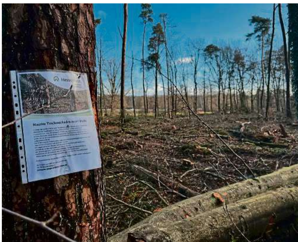
Kahl und trostlos: Auf diesem Stück zwischen Lämmerspiel und Obertshausen hat das Forstamt Langen Anfang des Jahres zahlreiche Buchen und Kiefern fallen müssen. Die Bäume waren gänzlich abgestorben.

Kontakt: vhs Kreis Offenbach Frankfurter Str. 160-166 63303 Dreieich 06103 3131-1313 vhs@kreis-offenbach.de