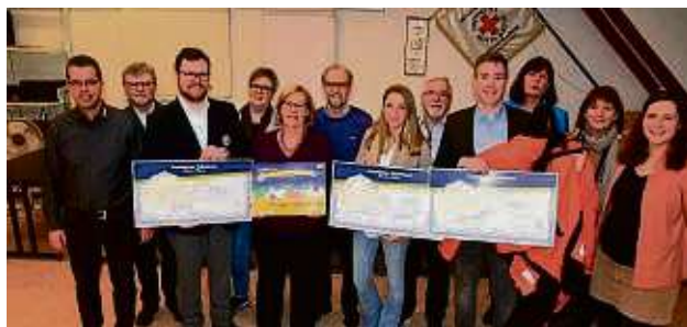
Mit dem Verkauf ihres Adventskalenders haben Lions Club und GMF eine stolze Summe erzielt und einen Teil davon an DLRG, DRK und Waldkindergarten gespendet.