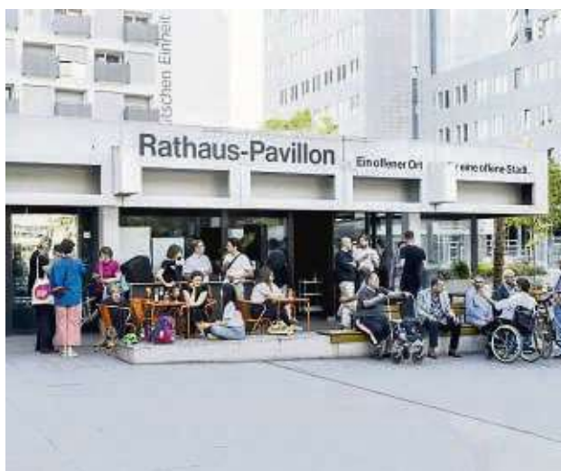
Der Rathaus-Pavillon wirkt wie ein Magnet – hier bei einer „Offen-Denken-Veranstaltung“ im Sommer 2023.

Und so soll es weitergehen: Einmal im Monat setzt das Clubformat „Open Dance“ seine Reihe fort. Das Dexterous Music Collective ermöglicht es jungen DJs, ihr Können in abwechslungsreichen Sets unter Beweis zu stellen und elektro-