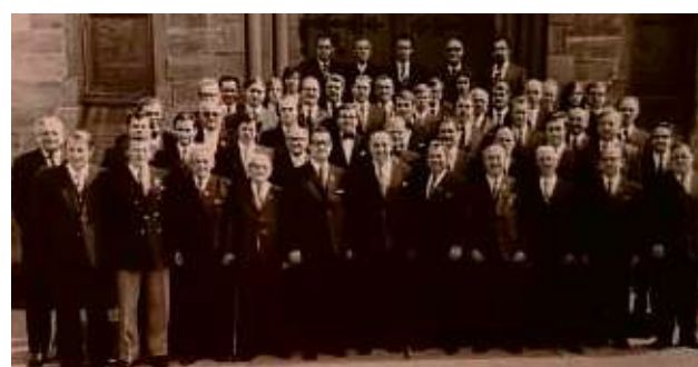
Vor 50 Jahren war der Männerchor noch stark besetzt.