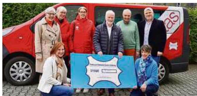
Vor dem roten Bus der Caritas-Straßenambulanz überreicht die Emma-und-Wilhelm-Spahn-Stiftung einen Scheck über 50.000 Euro.

Etwa 83 Prozent der Ausgaben sind Personalkosten, 17 Prozent machen Sachkosten aus. Die Krankenschwestern wechseln Bedürftigen den Verband, helfen beim Waschen, Rasieren, Haare oder Nagelschneiden, messen Blutdruck. Die Zuwendung geht weit über Pflegen hinaus, denn die Pflegekräfte schenken ein Lächeln, erzählen einen Witz und merken sich Geburtstage.