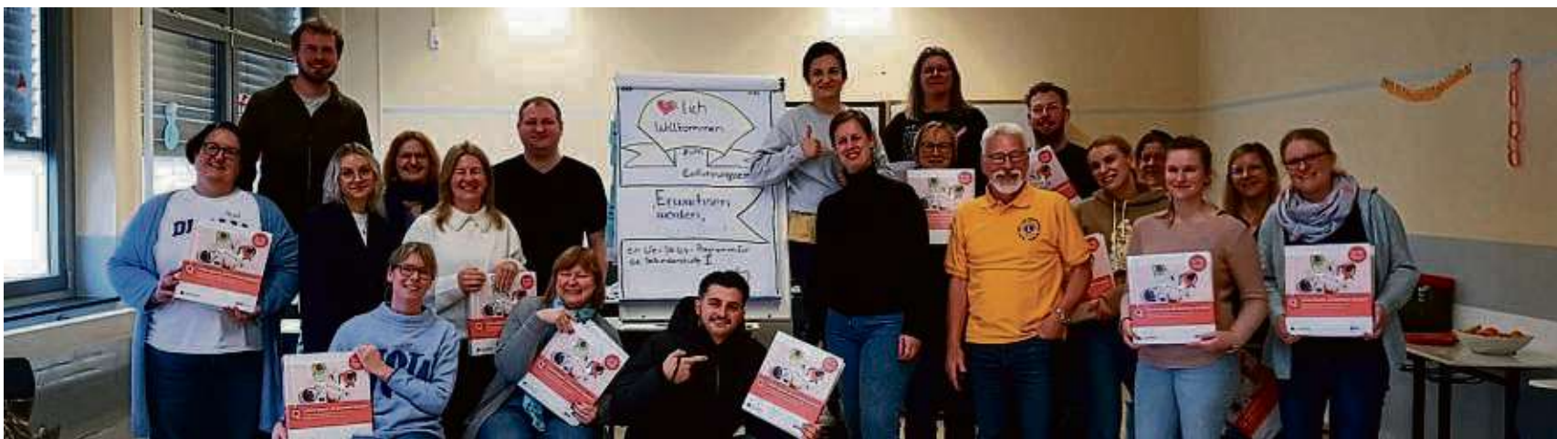
20 Lehrerinnen und Lehrer der weiterführenden Schulen Mühlheims sowie der Offenbacher Marienschule nahmen dieser Tage an einer „Lions Quest“-Fortbildung zum Thema „Erwachsen werden“ teil - unterstützt vom Lions Club Mühlheim.