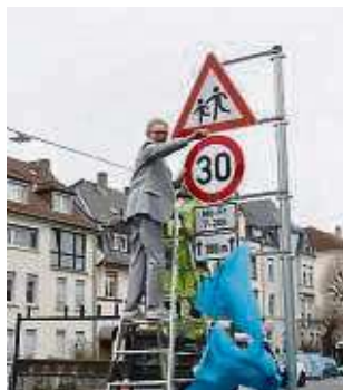
Die Bürgermeisterin hängt die Schilder auf.