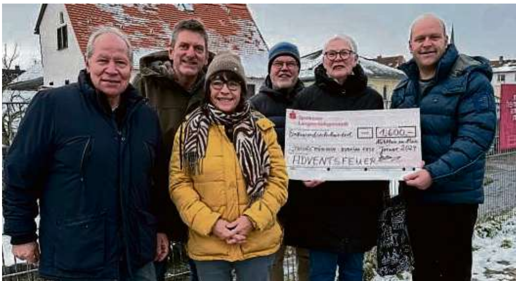
1600 Euro spendeten die Besucher des Adventsfeuers an den Afrikaverein Thiogo, der Hilfsprojekte in der Sahelzone unterstützt.

Angebote sind gültig: 01.02. – 07.02.2024