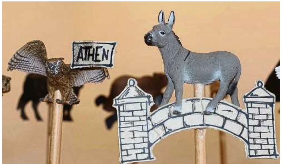
Kann man drauf kommen: Die Ausstellung „Mein Name ist Hase“ im Dreieich-Museum ist vergleichbar mit einem Besuch auf dem Rummelplatz der Redensarten. Start ist am 3. Februar.

Die Ausstellung in den Räumen des Dreieich-Museums nimmt rund 200 Sprichwörter unter die Lupe. „Mein Na-