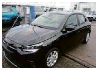
Opel Corsa F 1.2i. mit Automatik- getriebe. EZ. 12/2022, 100 PS., 1.Hd., viele Extras. Wie neu. 16.450 €. Autohaus Müller, Indus- triestr. 7, 63150 Heusenstamm ☎ 06104-8024444