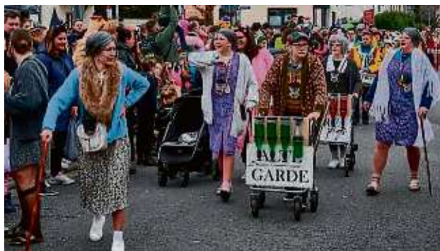
Die „Alte Garde“ schleicht über den Asphalt und freut sich des Lebens.