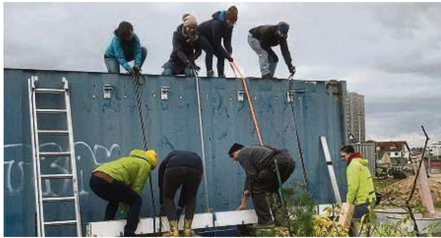
Tatkräftige Unterstützung: Der Juki-Farm-Verein werkelt fast nur dank ehrenamtlicher Hilfe auf dem Gelände. Im Winter waren Mitarbeitende des Arzneimittelherstellers Astra Zeneca vor Ort, die im Rahmen des Alle-zusammen-Tages Vereine mit Arbeitseinsätzen unterstützen.

„Das Feedback der Kinder und auch der Eltern war durchweg positiv“, sagt Eberhardt. Betreut wurden die Kin-