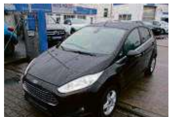
Ford Fiesta Bj. 2013, 115 TKM, 5-türig. Viele Extras, 6.950 € Auto- haus Müller, Industriestr. 7, 63150 Heusenstamm ☎ 06104-8024444