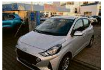
Hyundai i 10.Select. 25.000 KM. Bj. 22. Wie neu. 12.950 € Autohaus Müller, Industriestr. 7, 63150 Heu- senstamm ☎ 06104-8024444