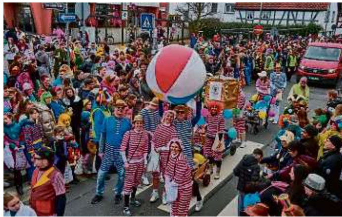
Gestreift und gut gelaunt zeigt sich die SGE-Abteilung Triathlon. Sie unterhält mit Bewegungsspielen.

Dann wird der Egelsbacher Umzug in die 60. Auflage gehen.