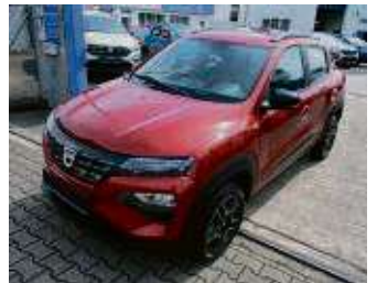
Dacia Spring Elektro Bj. 22. Wie neu. 5.000 KM, 14.950 € Autohaus Müller, Industriestr. 7, 63150 Heusenstamm ☎ 06104-8024444