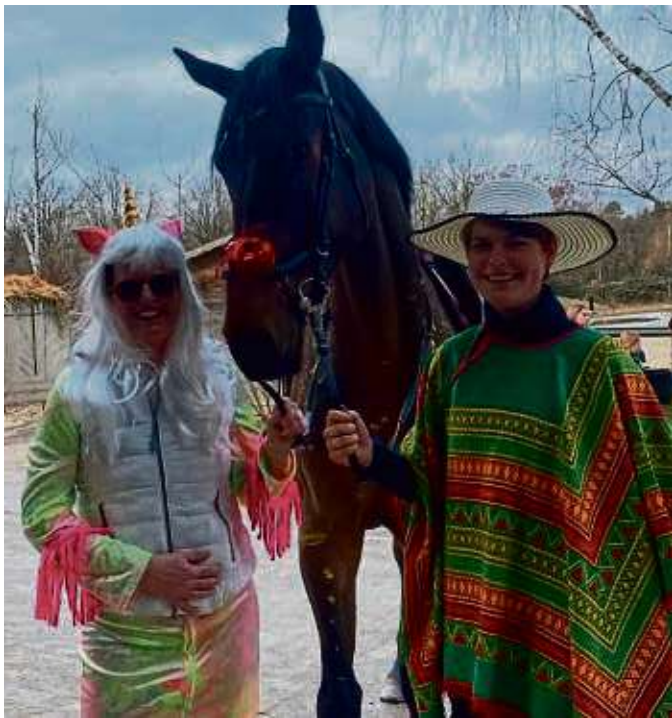
Natürlich waren beim Fastnachtsreiten des Reit- und Fahrvereins Kostüme erwünscht.