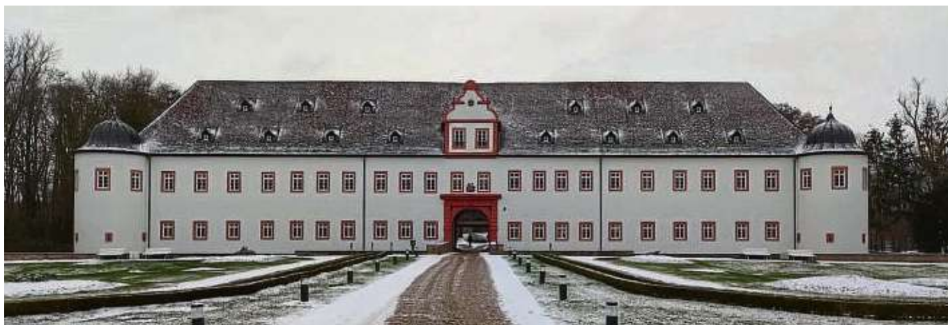
Versammeln soll sich das Parlament im Sitzungssaal des Schlosses.