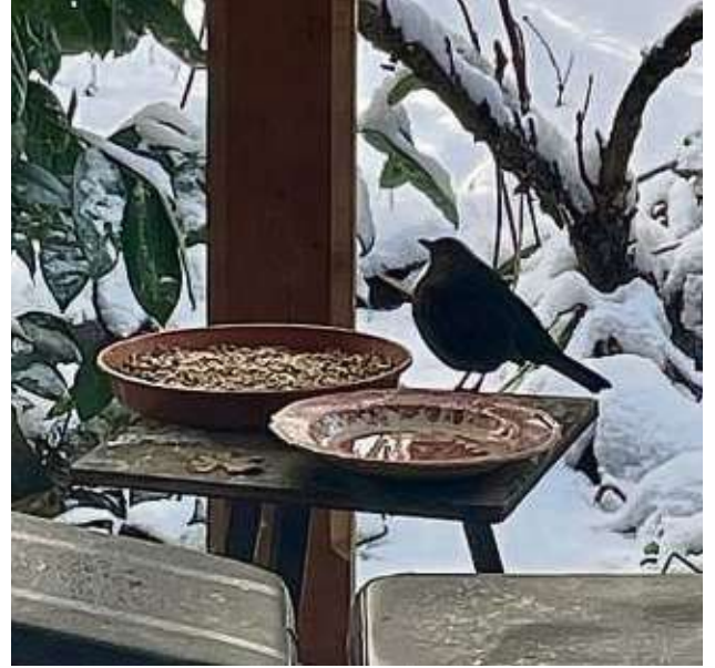
Winteridyll im Garten: Eine hungrige Amsel hat vor einer großen Schüssel mit Sonnenblumenkernen Platz genommen, es müssen nicht immer Haferflocken sein, sagen die Experten.

Die Fraktion der Weichfutterfresser besteht beispielsweise aus Rotkehlchen, Amsel, Zaunkönig, Star und Drossel. Ihnen schmecken besonders Rosinen, Obst und Haferflocken. „Man kann auch eine Mischung zubereiten aus Rindertalg, Rosinen, Haferflocken und Kleie“, empfiehlt Erlemann. Für die Körnerfresser lässt sich dieser „Eintopf“ ergänzen, indem