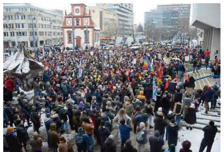
Bis zu 3.000 Teilnehmer nahmen an der Demo gegen Rechts teil. Nach der Kundgebung vor dem Rathaus zog der Tross zum Wilhelmsplatz.

Er hatte „Free Palestine“ ins Mikro gerufen und damit nicht nur viele Demonstranten gegen sich aufgebracht, sondern auch Lokalpolitiker und nun auch die jüdische Gemeinde.