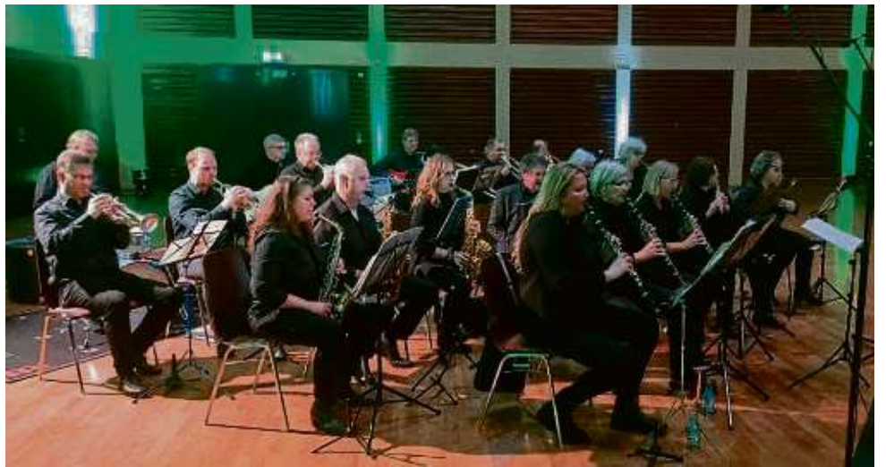
Mit dem Heusenstammer Lied eröffnet die Stadtkapelle den ersten Neujahrsempfang in der großen Halle des Zentrums Martinsee. Mehrere Hundert Gäste wohnten der rund dreistündigen Veranstaltung bei.