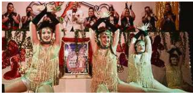
Mit ihrem Schautanz zog die Tanzsportabteilung der Raga Publikum und Elferrat (hinten) in den Bann.