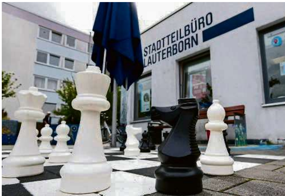
Stadtteilbüro und Seniorentreff finden sich in Lauterborn unter einem Dach.