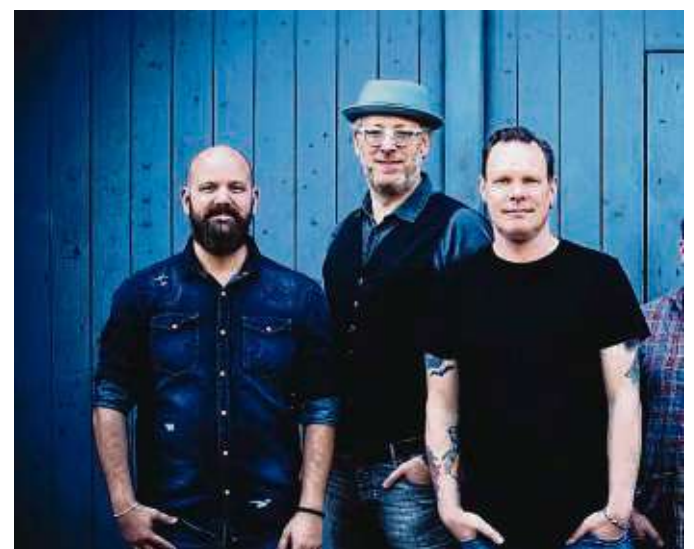
Klassiker von den „Dire Straits“ spielt die Gruppe „Brothers In Arms“, die Ende Mai im Heusenstammer Schloss auftritt.

Tickets gibt es im Geschäft „Das Buch“, in allen bekannten Vorverkaufsstellen, online auf echt-hartmann.de und beim Veranstalter in der Goethestraße 7. Die Veranstaltungen beginnen jeweils um 20 Uhr, Einlass ist ab 19 Uhr. nb