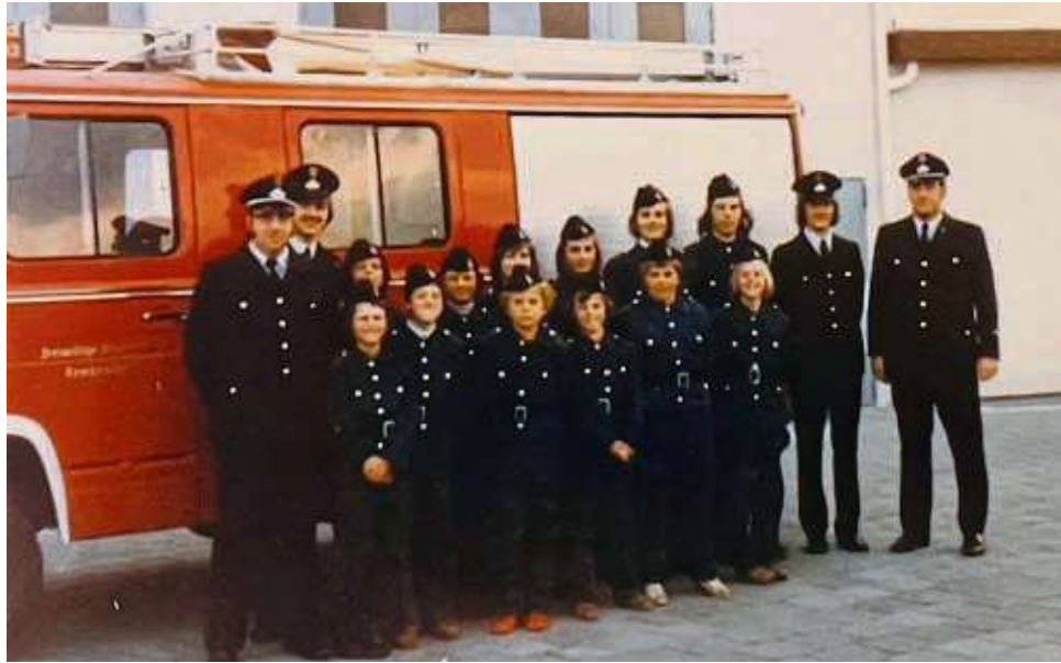
Der erste Jahrgang: 14 Jungs zwischen treten der Jugendwehr Rembrücken am 26. Januar 1974 bei. Gründungsort ist die Sozialstation.

Damit die Jungen und Mädchen ihre Einsätze auch körperlich durchhalten, steht – wie schon seit 1974 – Bewegung auf dem Programm. Jeden Montag treffen sich die Jugendlichen zum gemeinsamen Sport in der Turnhalle der Matthias-Claudius-Schule. Das Miteinander stärken sie bei gemeinsamen Aktionen – ob Altglas sammeln oder die