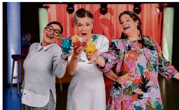
Drei Mädels in Partylaune, kombiniert mit einem bunten Mix aus bekannten Songs: das verspricht die Musikkomödie „Weiber“.

Musikkomödie „Weiber“ kommt nach Offenbach