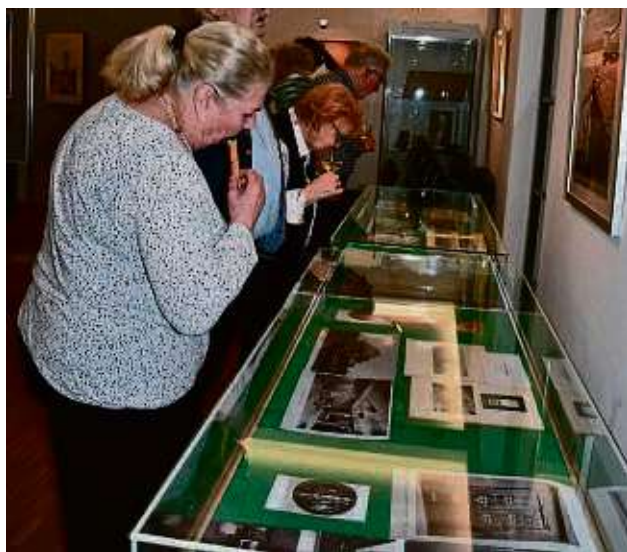
Historische Dokumente informieren die Besucher über das Leben der beiden Heusenstammer Söhne.