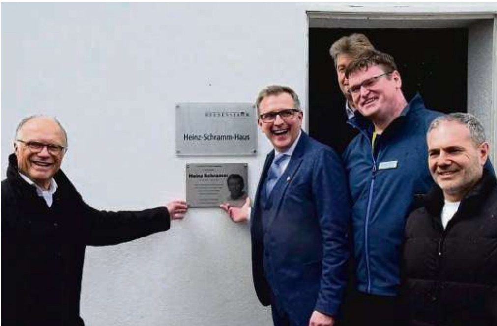
Zwei Schilder weisen nun auf den Namensgeber des Heinz-Schramm-Hauses am Bad Heusenstamm hin.