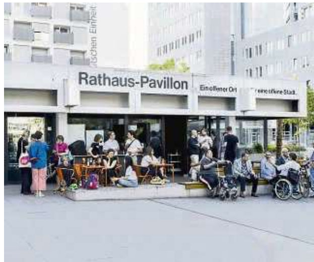
Der Rathaus-Pavillon wirkt wie ein Magnet – hier bei einer „Offen-Denken-Veranstaltung“ im Sommer 2023.

Und so soll es weitergehen: Einmal im Monat setzt das Clubformat „Open Dance“ seine Reihe fort. Das Dexterous Music Collective ermöglicht es jungen DJs, ihr Können in abwechslungsreichen Sets unter Beweis zu stellen und elektro-