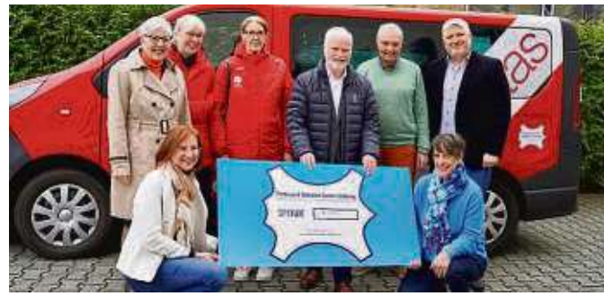
Vor dem roten Bus der Caritas-Straßenambulanz überreicht die Emma-und-Wilhelm-Spahn-Stiftung einen Scheck über 50.000 Euro.

Etwa 83 Prozent der Ausgaben sind Personalkosten, 17 Prozent machen Sachkosten aus. Die Krankenschwestern wechseln Bedürftigen den Verband, helfen beim Waschen, Rasieren, Haare oder Nagelschneiden, messen Blutdruck. Die Zuwendung geht weit über Pflegen hinaus, denn die Pflegekräfte schenken ein Lächeln, erzählen einen Witz und merken sich Geburtstage.