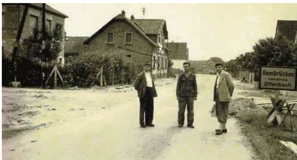
Eine eigenständige Gemeinde ist Rembrücken noch Mitte der 1960er Jahre. Im Zuge der Gebietsreform des Landes Hessen zwischen 1970 und 1977 entscheiden sich die Anwohner für eine Eingliederung nach Heusenstamm.