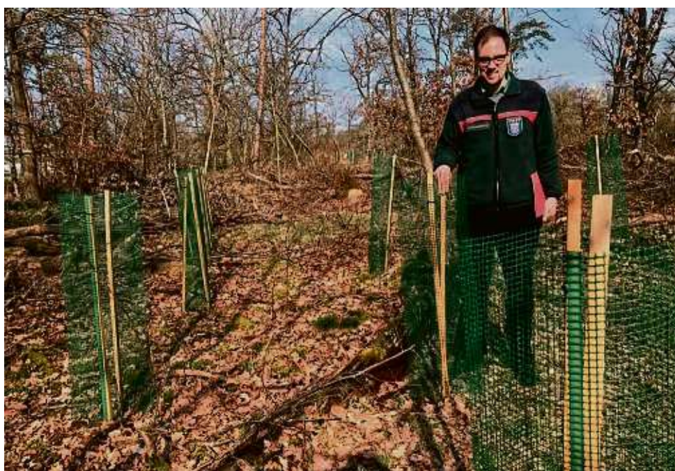
Neue Bäume für den Wald: Eine Anpflanzung von etwa 500 Esskastanien gegenüber dem Sportzentrum „Martinsee“.

Asklepios Klinik Langen, Röntgenstr. 20, 63225 Langen