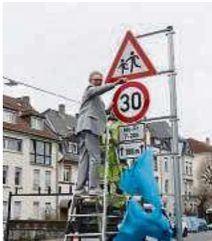
Die Bürgermeisterin hängt die Schilder auf.