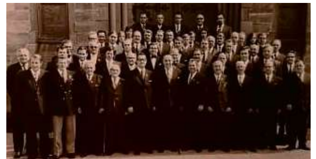
Vor 50 Jahren war der Männerchor noch stark besetzt.