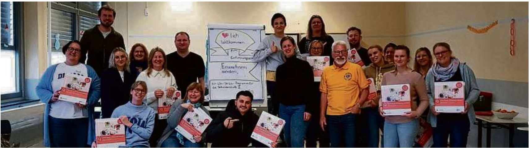
20 Lehrerinnen und Lehrer der weiterführenden Schulen Mühlheims sowie der Offenbacher Marienschule nahmen dieser Tage an einer „Lions Quest“-Fortbildung zum Thema „Erwachsen werden“ teil - unterstützt vom Lions Club Mühlheim.