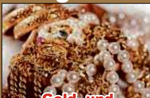
Gold- und Silberschmuck