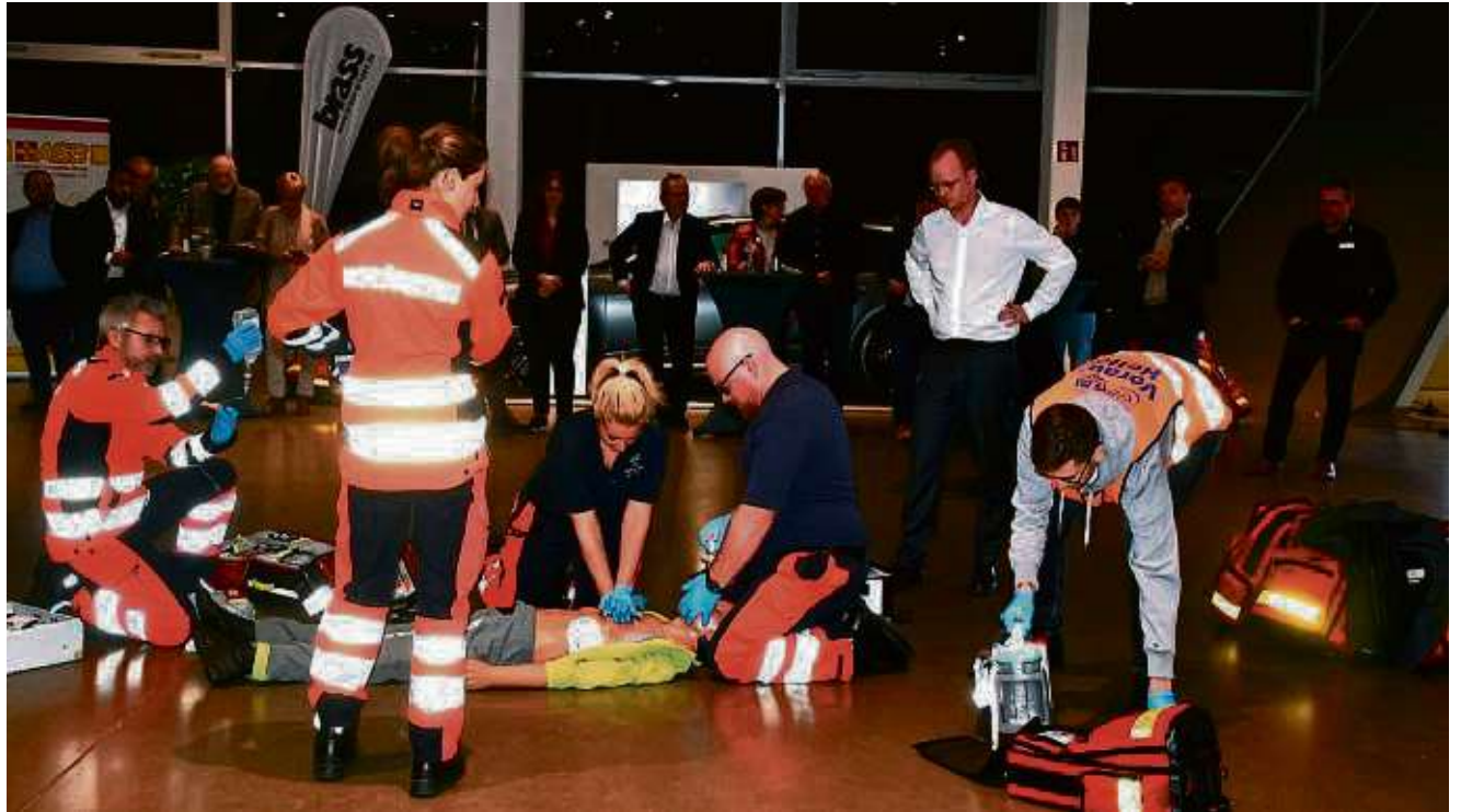
Spannungsreiche Simulation: Rettungskräfte zeigen während der Veranstaltung, worauf im Notfall zu achten ist.

Das sei umso wichtiger, als dass es im Kreis Offenbach eine ständige Herausforderung für die Rettungskräfte sei, in dem oft dichten Verkehr rechtzeitig vor Ort zu kommen.